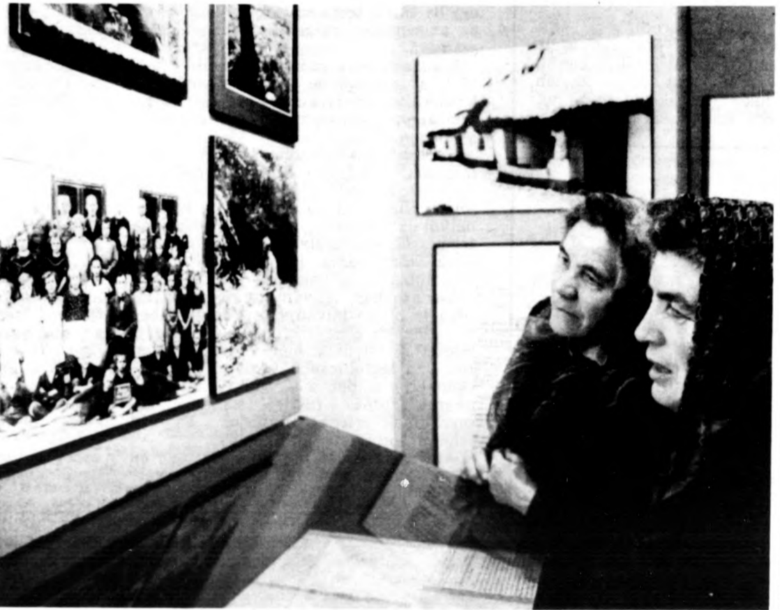
A költészet napján avatták fel Simon István Kossuth-díjas költő emlékházát Bazsiban