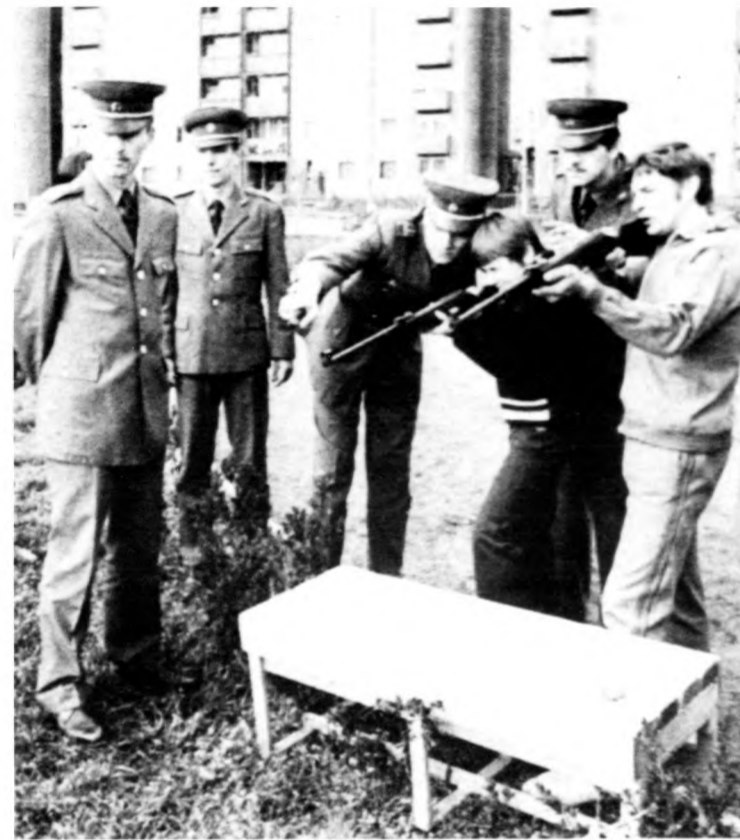
Az összetett honvédelmi verseny egyik mozzanata

Először a gyakorlati számokat (összetett honvédelmi verseny, légfegyveres lövészet) bonyolították le, majd nyolcfordulós szellemi vetélkedőn folytatódott a pontvadászat.