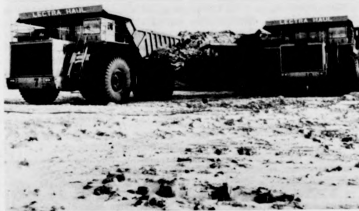
Nyerjungri térségében egy megnyitás előtt álló külszíni szénbánya öt-hat méternyi földtakaróját szállítják el az erőgépek