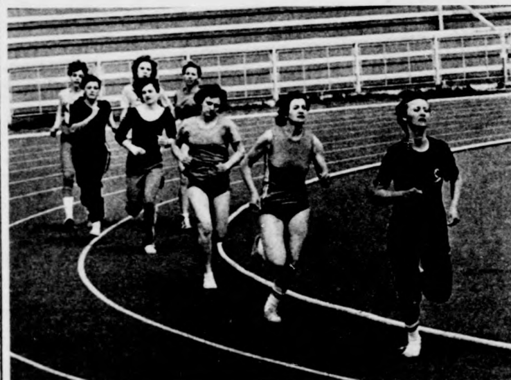
A lányok 600 m-es síkfutásának mezőnye az előfutamban. A győzelmet az utolsó helyen futó kislány szerzi meg

Debrecenben rendezték az V. szakkunokástanuló-olimpiát, melyen hat sportágban több mint 900 tanuló vett részt. A DMVSC Oláh Gábor utcai sportkomplexumban, a Nagyerdei Gyógyfürdő, valamint az apafai lőtér adott otthont a kitűnően rendezett sporteseménynek.