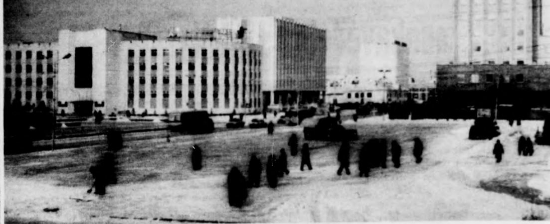
A főváros, Jakutsk főtere