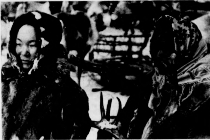
Jakut rénszarvaspásztor felesége és leánya