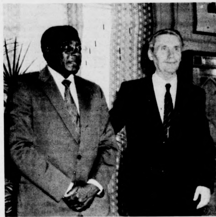
Robert Mugabe és vendéglátója, Lázár György megbeszélésük előtt.