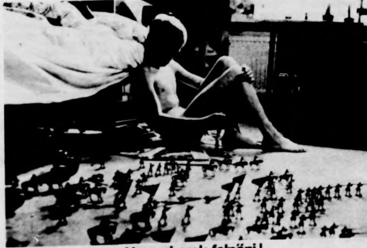
Nem akarok felnőni! Színes színes filmrészlet • Rendezte: KAY POLLAK

Nicolas Margireau rendező a román festészet e század-