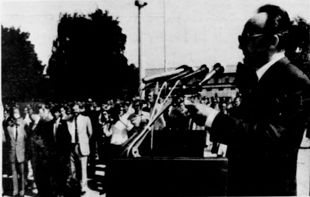
Veress Péter külkereskedelmi miniszter megnyitó beszédével megkezdődött a hagyományos tavaszi Budapesti Nemzetközi Vásár

az MSZMP Politikai Bizottságának tagja, a Központi Bizottság titkára, Marjai József, a Minisztertanács elnökhelyettese, továbbá az Elnöki Tanács és a kormány több tagja. Megjelentek a diplomáciai képviselők vezetői és tagjai, a hazai és külföldi kiállítók képviselői. A Himnusz elhangzása után Veress Péter külkereskedelmi miniszter mondott beszédet.