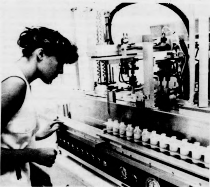
A Hajdú megyei Tejipari Vállalat debreceni laboratóri- umában korszerű berendezésekkel vizsgálják a nyers tejet