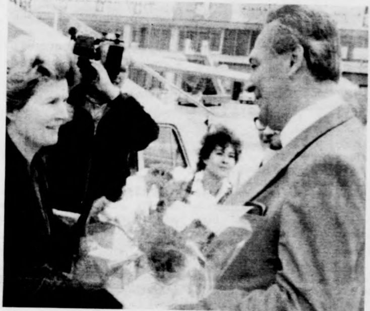
A csehszlovák fővárosba érkező külföldi delegációk között megkülönböztetett szeretettel fogadták Valentyina Tyereskovát , a szovjet nőszövetség elnökét.

Pozsgay Imréné , a Hazafias Népfrent Országos Tanácsa főtitkárának vezetésével hétfőn elutazott Budapestről az a delegáció, amely hazánkat képviseli a prágai béke-világtalálkozón. A küldöttség búcsúztatására a Ferihegyi repülőtéren megjelent Andrej Barcák , Csehszlovákia budapesti nagykövete is. (MTI)