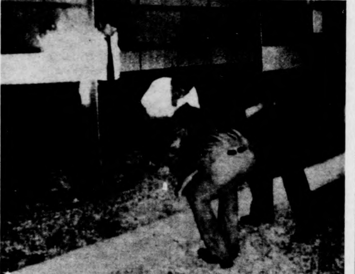
Peruban a rendkívüli állapot bevezetése ellenére sem szűnt meg a terrorcselekmények. Képünkön: szakértők kutatnak robbanószerek után a főváros egyik luxus szállójában. Volt olyan éjszaka, amikor Limában egy tucat bombamerényeletet követtek el