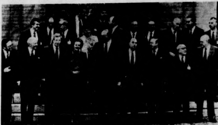
A legtöbb kérdésben kompromisszummal, illetve a döntés elhalasztásával végződött a közös piaci vezetők csúcsértekezlete. Képünkön: a stuttgarter tanácskozás résztvevői