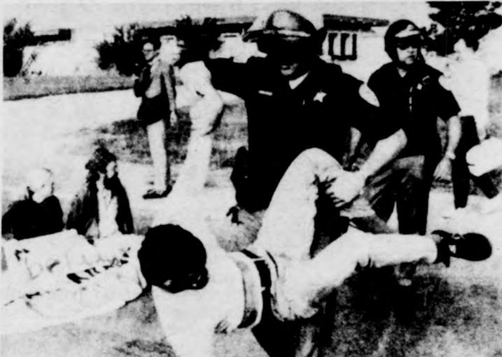
Az Egyesült Államokban több száz embert tartóztattak le a héten tartott atomfegyverkezés-ellenes tüntetések során. Képünkön: a nukleáris fegyverprogramokban is részt vevő Northrop cég egyik gyáregységénél tiltakozó fiatal hurcolnak el a rendőrök