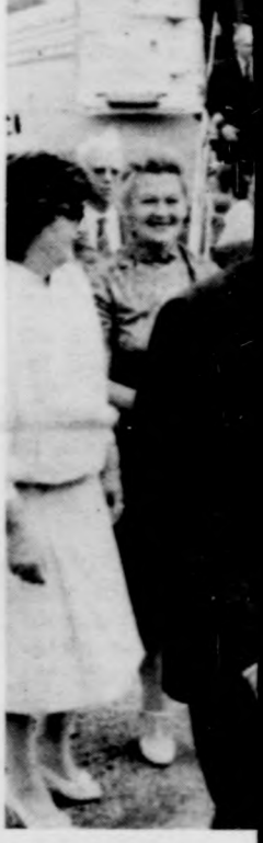
Büld Ulusu és I.

Lázár Györgyne gyar Népköztársasg terianácsa elnöke hívására szerdán látogatásra Budapest Büld Ulusu Köztársaság minis. A Ferihegyi rep. ahol délelőtt fél landolt a török és hivatalos kísérel különrepülőgéppeslyesen fogadták ket. A magyar és iókkal díszített lég-