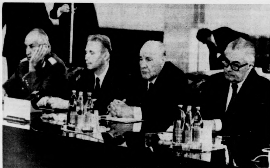
A Kádár János vezette magyar delegáció.

Hét szocialista ország párt- és állami vezetőinek tanácskozása