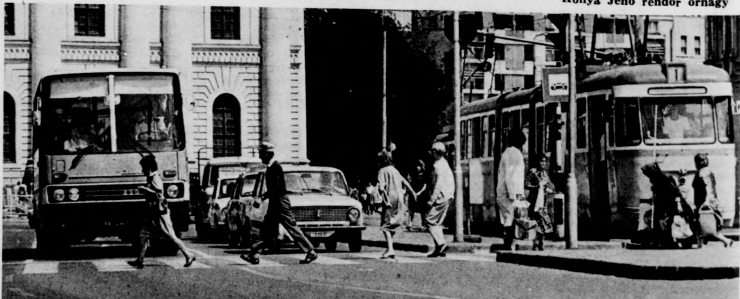
Gyalogosok „tánca” a tilosban