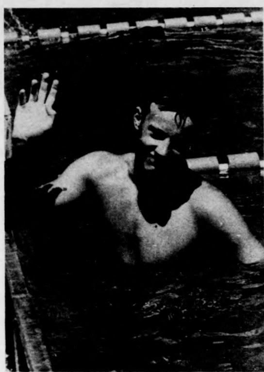
Kicsit gondolkodik, topreng, felegett, hamló orrhegyét tapogatja.

— Mire emlékszel abból a fél percből? — Mire emlékszel abból a fél percből?