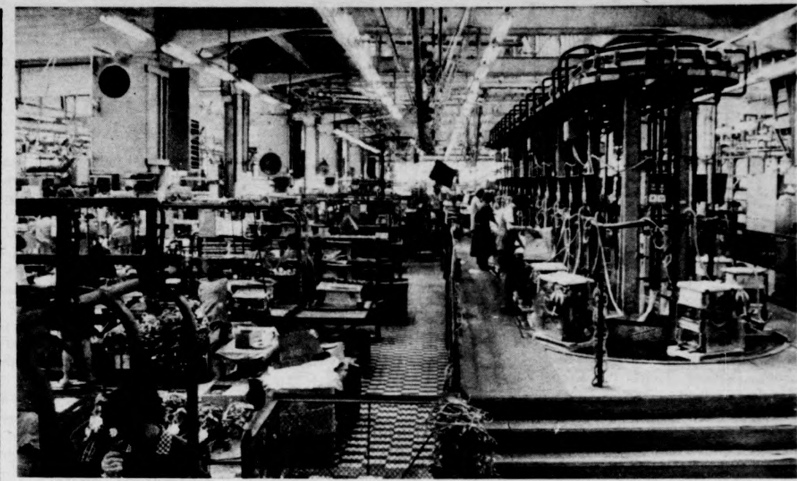
Automata mosógépek a sze relőszalagon

E célkitűzések és határozatok minden bizonnyal a kistermelők érdekeit szolgálják. Am ezáltal természetesen a népgazdaságát is.