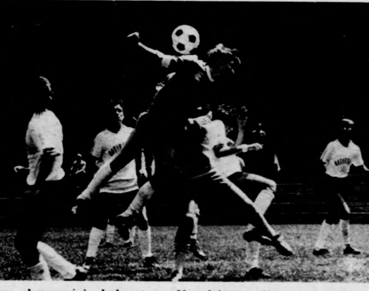
Egy kaposvári helyzet a Nagybatony ellen