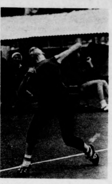
Messzire repül a kislabda