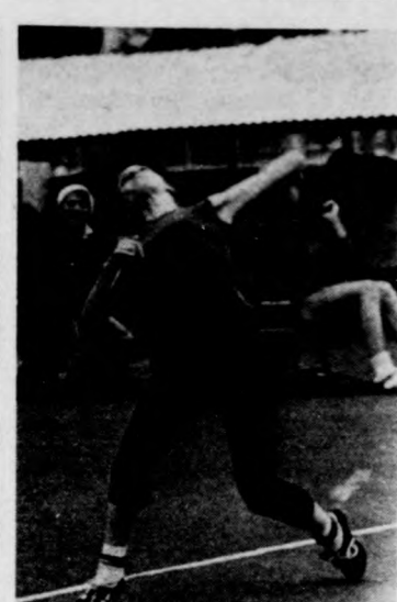
Messzire repül a kislabda