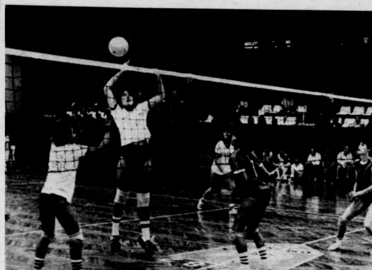
Szemben a debreceni Arany János iskola lányai a Pecs elleni találkozó

tos gyerekek összetett versenyt bonyolítják le, tornában pedig a tagozatosok mellett a „normál” osztályba járó gyerekek döntőjére is ma kerül sor. A tollaslabdázók kétnapos, a kézisek, a kosarasok, a röplabdások és a futballisták pedig ötnapos küzdelem után vehetnek majd részt az eredményhirdetésen.