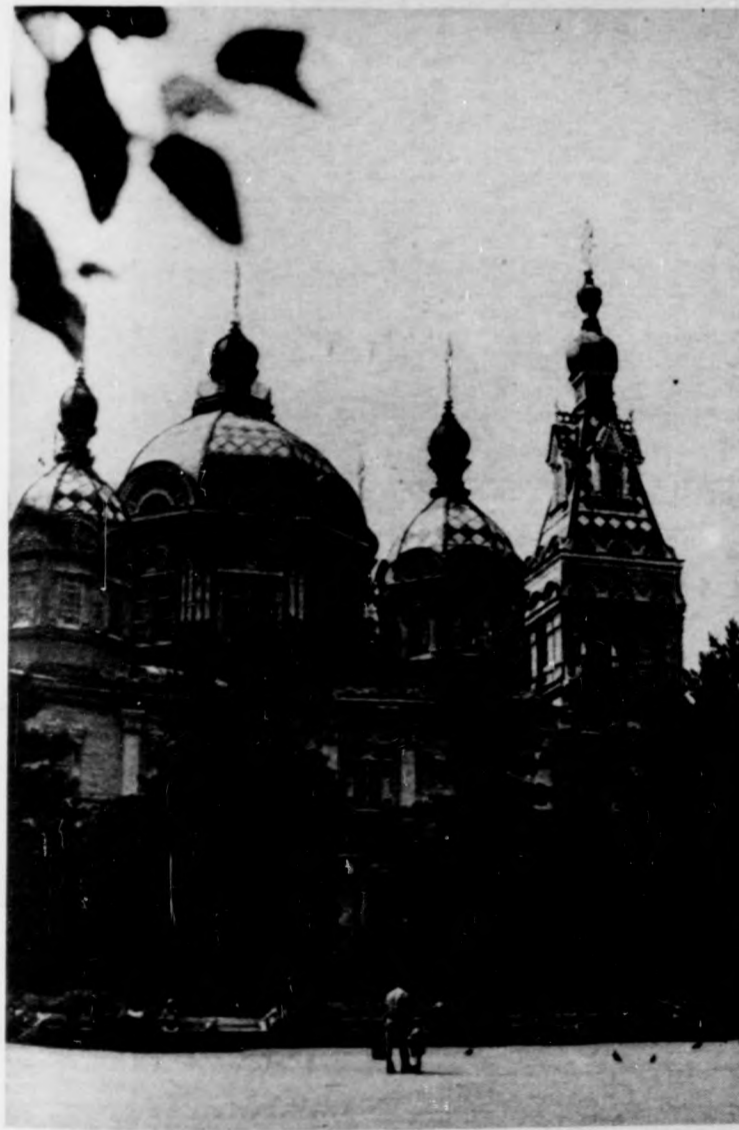
Alma-Ata egyetlen műemléke: egy szöveg nélkül épült fatemplom, amely az 1907-es földrengést is túlélte...