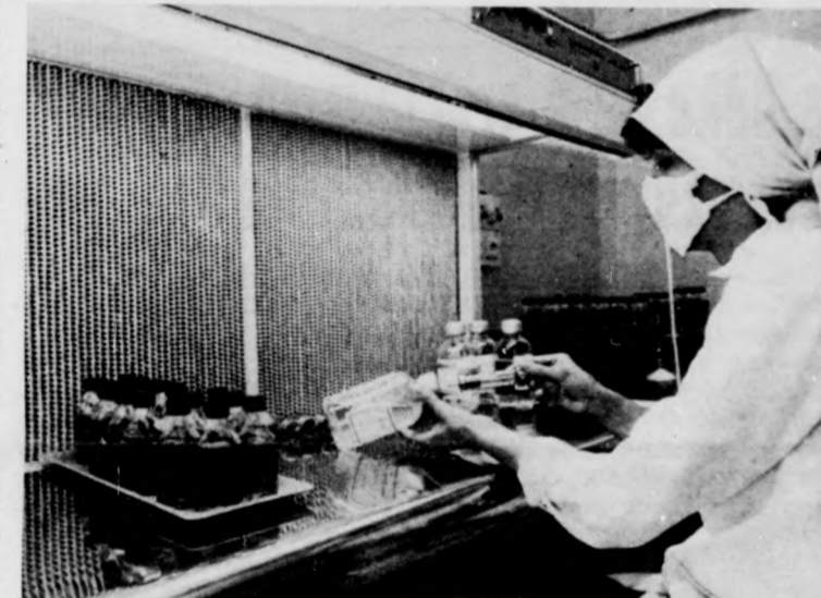
A debreceni Gyógyszertári Központban is használják a lamináris boxot

selejtező és gyógyító ágazatokban, de most már onnan is egyre több megrendelés érkezik a vállalathoz — évente mintegy 100—150 boxot készítenek. A termék gyártása igen gazdaságos, így továbbfejlesztéséhez nem kis érdeke fűződik a debreceni vállalatnak. A berendezést szeretnék külföldön is értékesíteni, ezért kiállították már Plovdivban és Brnóban is. Ez év őszén Moszkvában az ott megrendezésre kerülő tudományos kiállításon is bemutatkozik a termék.