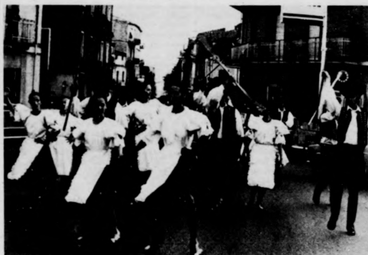
Utcai felvonulás Nicastróban

Ez az elragadtatót felkiáltásként kiejtett olasz mondat a fesztivál gálaműsorát bevezető utcai felvonuláson ütötte meg a fületem. A Forgórózsza együttes tagjai az ajáki leánytánc, a mezősegi legényes és a szűkebb hazánk néphagyományait is felviláglató hortobágyi pásztortáncok elemeit illesztették menettáncukba, így vonultak végig a díszesen kivilágított színpadutcán. Magam, fényképezgetvem közben, oldalról követtem őket. A nézőseregben egy aprócska gyerek lelkesedve fordult édesanyjához, amikor a debreceni táncosok elhaladtak előtte. „Mamma, questa è molto bella!” — mondta. — Anyukám, ez olyan szép... Az óriási, kétszintes színpadhoz vezető fűtécát, a Viktor Emléki olasz királyról elnevezett kortól lámpionok és színes izzókkal kivilágított díszkapuk változtatták