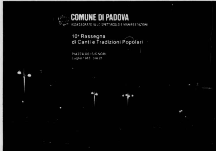
A padovai fellépés színhelye — a műsorfüzet címlapján