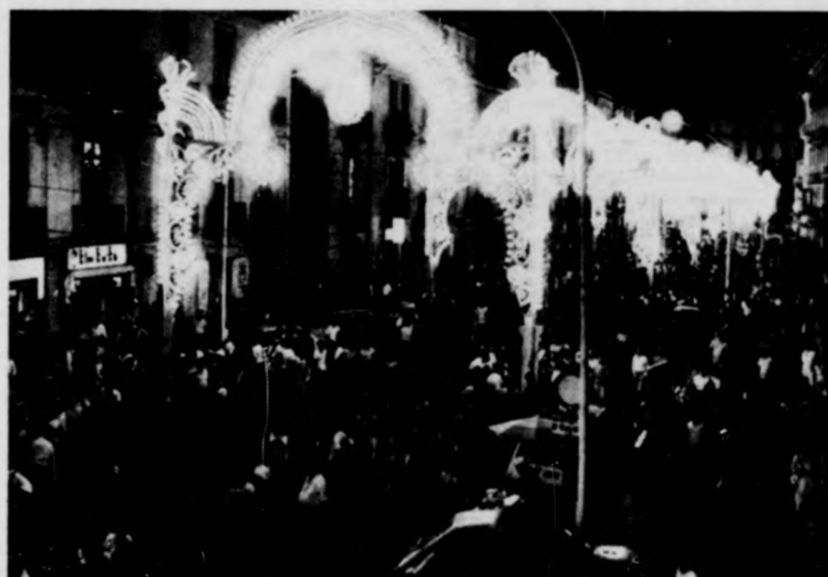
A kivilágított fesztivál-főutca a gálaműsor napján még éjjelkor sem néptelenedett el