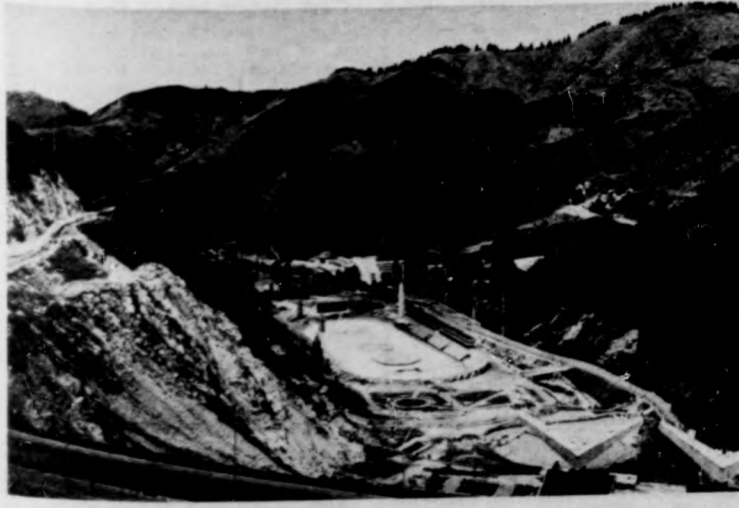
A MEDEO a város békéjét is őrzi