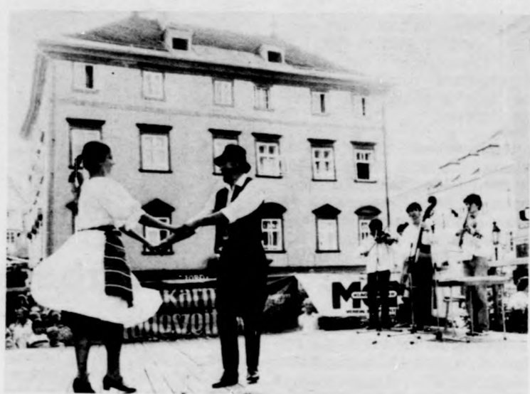
Jelenet a tusából

Az együttesek öt alkalommal álltak közönség elé. Ezek közül a második napi gálaest ígérkezett a legszínvonalasabbnak. Ez egyben a házigazdák ünnepi műsora volt az ÖGB szakszervezeti palota tanácstermében. A késő