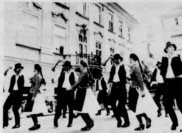
Dél-alföldi tánc az Alten Platzon

En tulajdonképpen itt éreztem meg először, hogy nekünk hangosabban szólt a