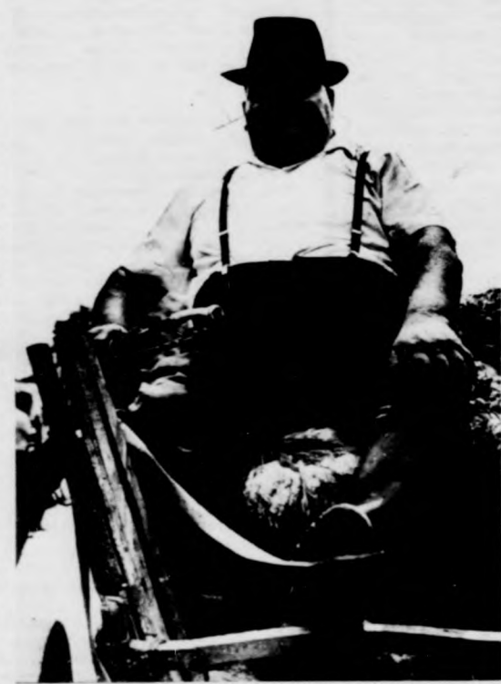
Kunkovács László: Böszörményi parasztember Vencsellei István: Ásott kút (1982)