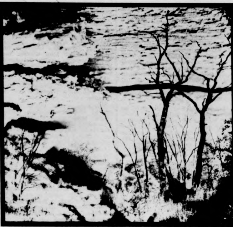
Ilku János: Ohati erdő (részlet)