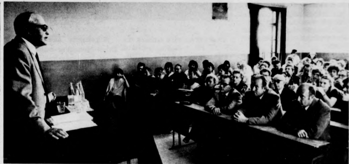
Előadás a nyári egyetemen

Az új kisvállalkozásokban a múlt év végén mintegy 65 ezren dolgoztak. Többségük megtartotta eredeti munkahelyét, s itt szabad idejében tevékenykedik. Főállásban az ötmillió kereső közül mindössze 18 ezren dolgoztak az új típusú gazdasági szervezetekben, vagyis az új vállalkozási formák nem idéztek elő jelentősebb munkaerő-áramlást.