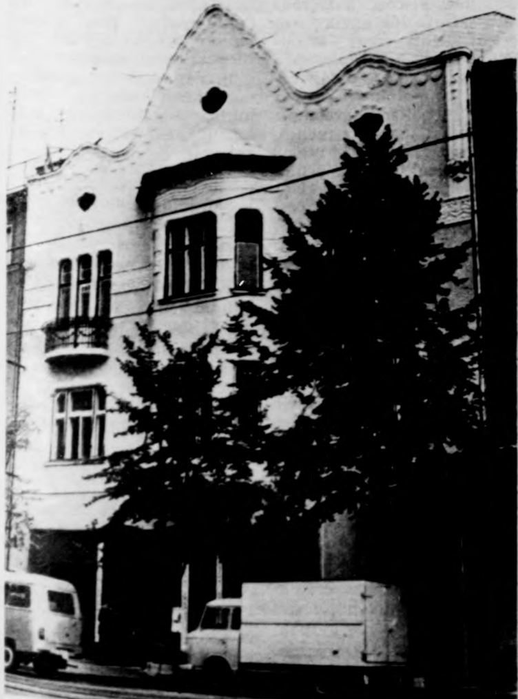
Az épület homlokzata