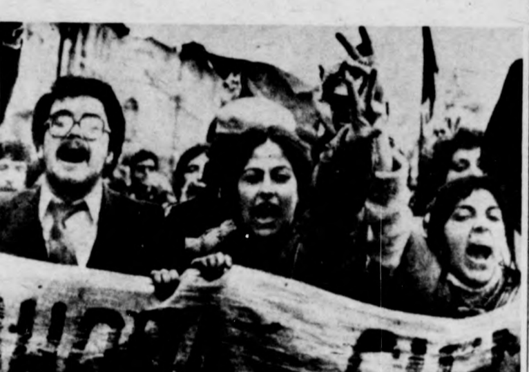
Chilében újabb kormányellenes megmozdulásokat szerveztek. Képfő: tüntető fiatalok felvonulása a santiagói betvárosban.