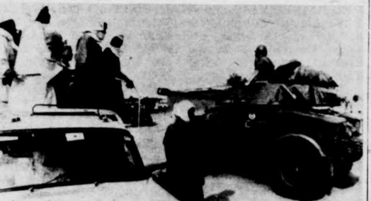
A fegyverszüneti felhívások ellenére Csádban a héten sem csökkent a feszültség. Képfő: francia páncélos áll őrt a fővárosból Massakori felé vezető országúton is.