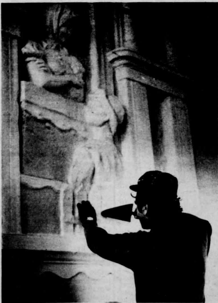
Újjáélednek a kapualj szobrai is