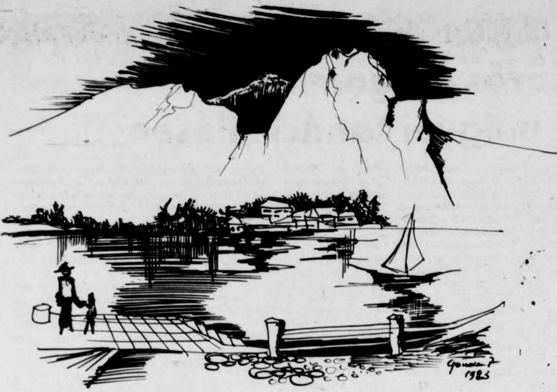
Gonda Zoltán: Svájci útirajz (toll)