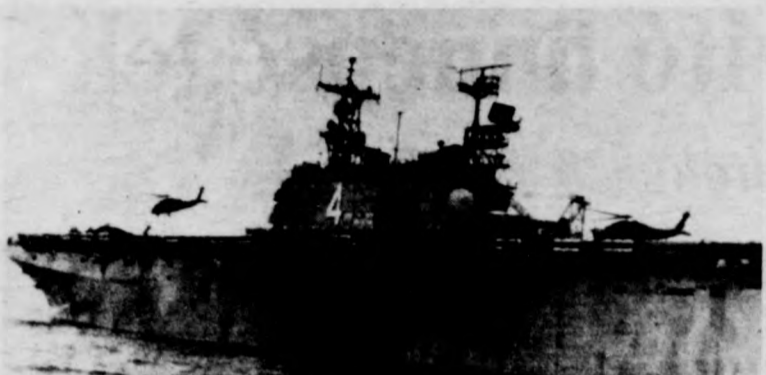
Nicaragua partjainál folytatódott a nagyszabású amerikai-hondurasi gyakorlat. Képfő: amerikai szállító helikopterek szállnak fel a Nassau hadihajó fedélzetéről Puerto Cortes közelében.

A tét: megakadályozni, hogy Izrael visszavonuljon kisebb libanoni területre, de — a hosszan tartó megszállás