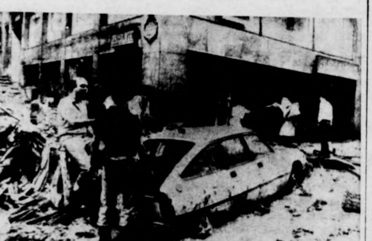
A becslések szerint legalább 40 halálos áldozata van a Spanyolország északi részén pusztított árvíznek. Képfő: elöntött utcák, vízbe-sárba süppedt járművek a baszkföldi Bilbao-ban