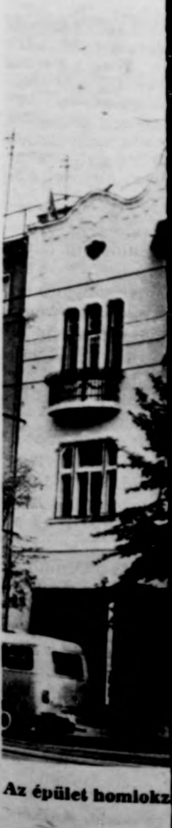
Az épület homlokza