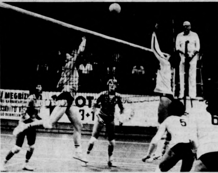
Magyar leütés, egytagú román sánccal