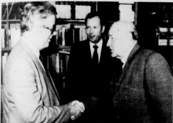
Kádár János fogadta Sir Geoffrey Howe brit külügyminisztert