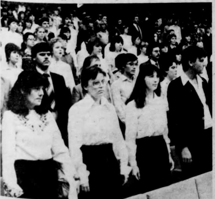
Az új elsőévesek

Az elsőévesek köszöntése után az Internacionálé hangjaival ért véget az ünnepség.