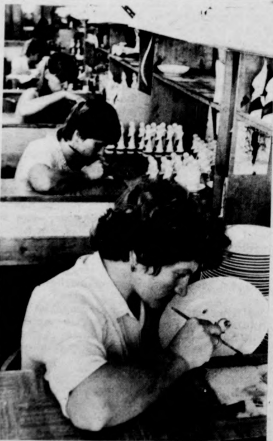
Kézfestésű tányérok, figurák készülnek