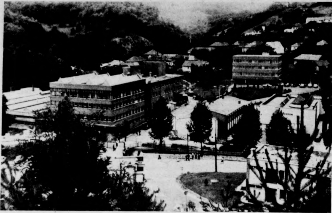
A hollóházi gyár látképe