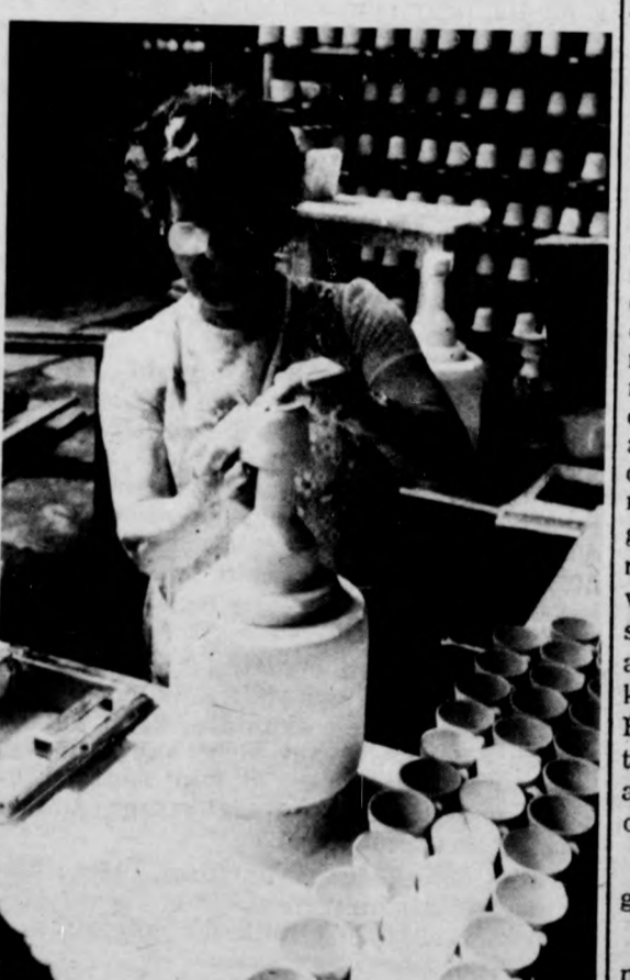
Az öntési széleket kendővel tüntetik el a figuráról