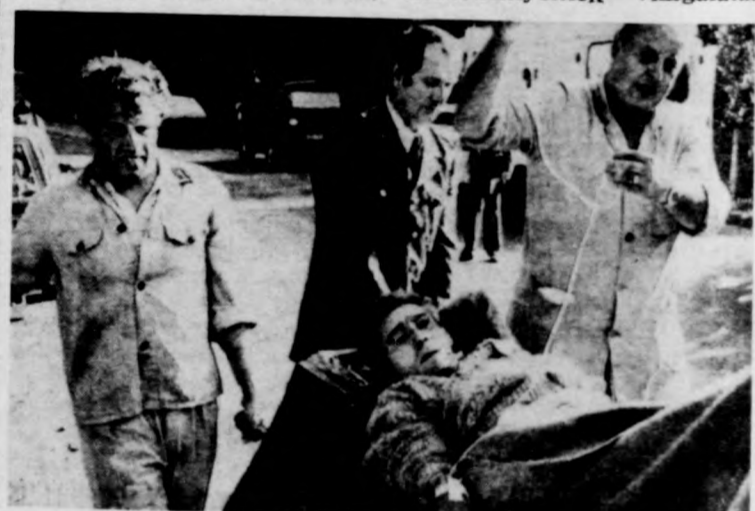
A baleset egyik sebesültjét a mentőautóhoz viszik