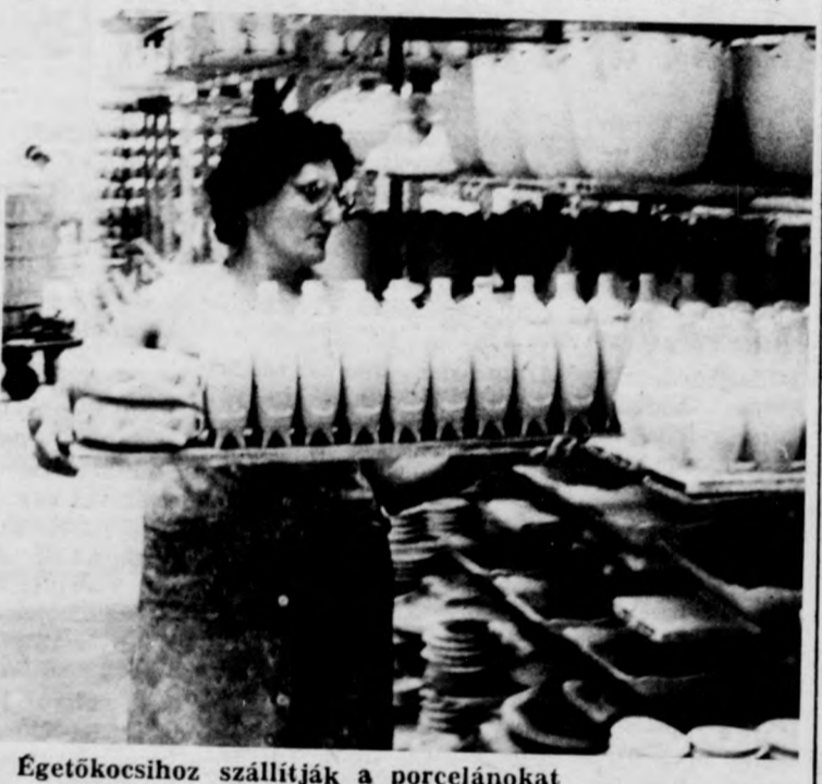
Égetőkösihoz szállítják a porcelánokat