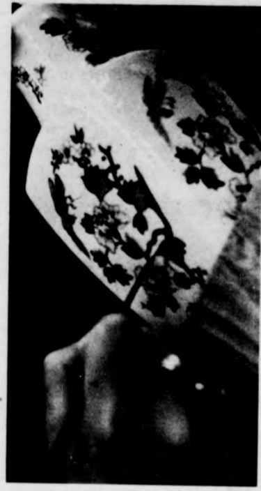
Új porcelánképek születése, melyek porcelánfalak gyártásához is vezetnek.