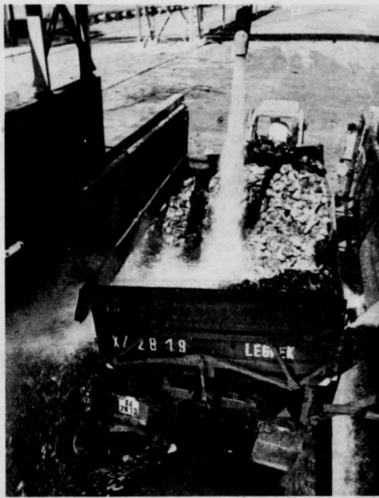
Vízugárral mossák a beérkezett répát

Képeink a szezonkezdéskor készülték, megörökítve a cukorgyári munkafolyamatok egy-egy pillanatát.