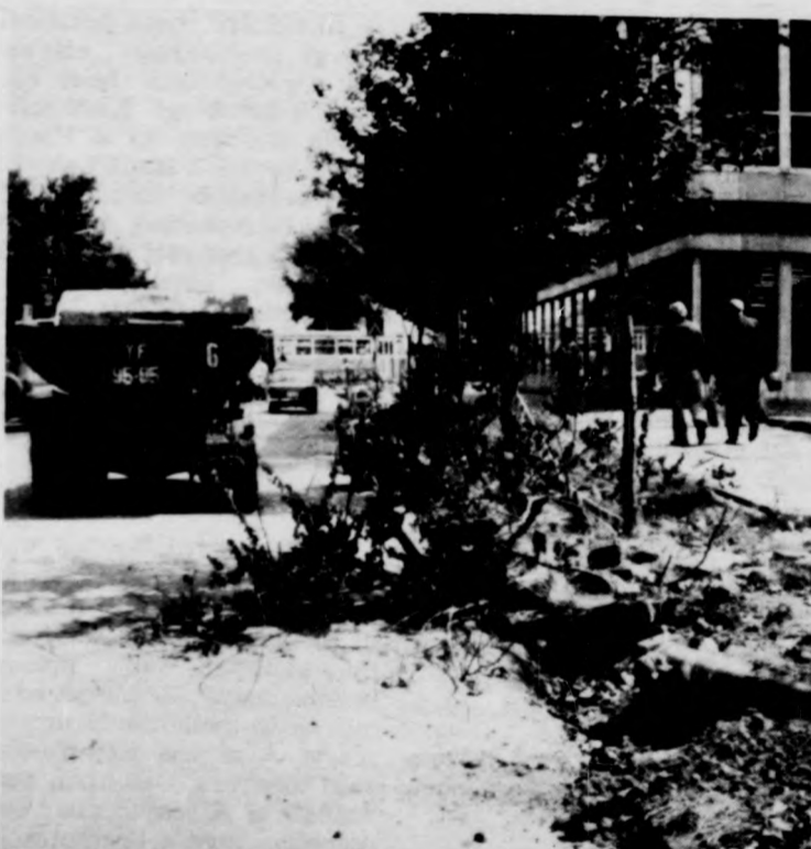
Felvételünk a debreceni Erzsébet utcán készült, az utépítési árnyoldalairól. Az egyik kis fa kitörve hever a földön, a másiknak (alig látszik) a törzséhez léccel szegezték, s meg-sinyli a gyeper is a felvonulást.