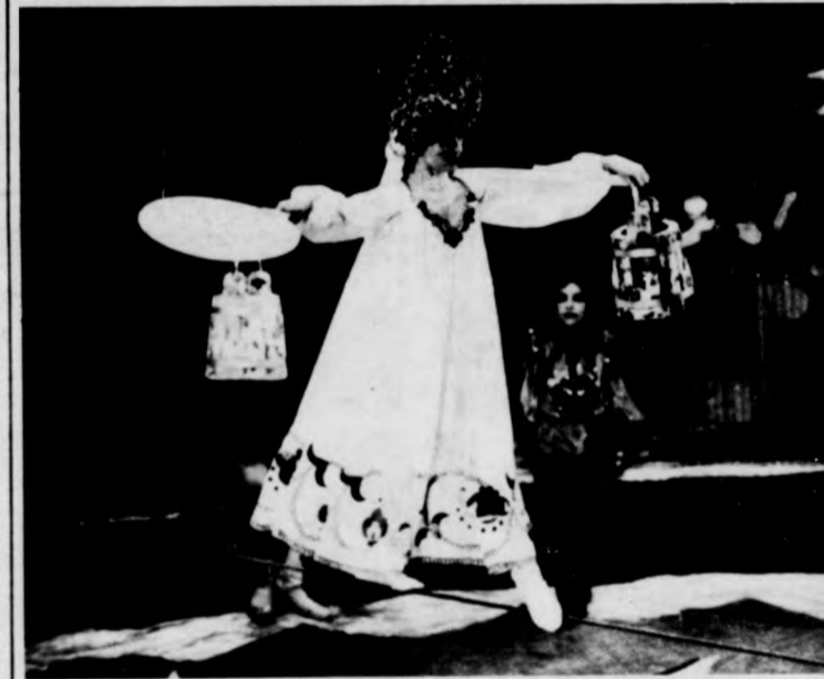
Különösen tünik első hallásra az ötlet: Puszkint cirkuszporondra vinni.

A Fővárosi Nagycirkuszban ilyen Ruszlán és Ludmilla-előadást látunk, s egyben tanúi lehetünk a nagy múltú szovjet cirkuszművészet — s általánosabban véve is a művészeti ág — továbbfejlesztését célzó törekvéseknek.