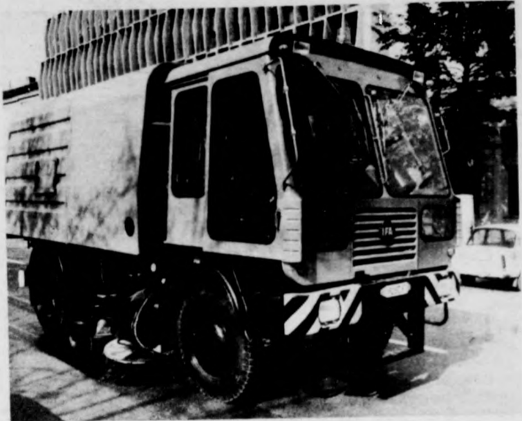
Egy a kevés új gép közül

A normális parkfenntartás évente az összes terület 8—10 százalékának a felújítását kívánja. 1982-ben 1,8 százalékot újítottak fel. Megint má-