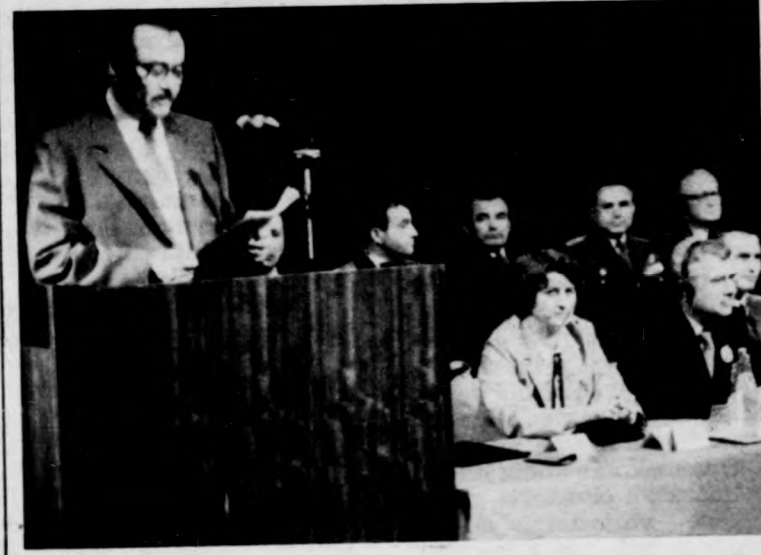
(Folytatás a 2. oldalon)

ünnepeket rendezett Debrecenben, a Kölcsey Művelődési Központban. Az ünnepség elnökségében többek között