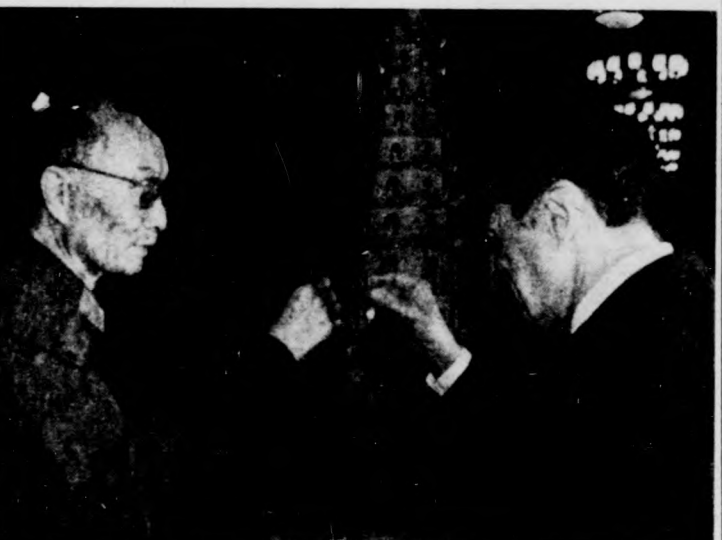
Pekingben tárgyal az amerikai hadügyminiszter. Képünkön: Caspar Weinberger (jobbra) és kínai kollégája, Csang Aj-ping egy diszvacsorán