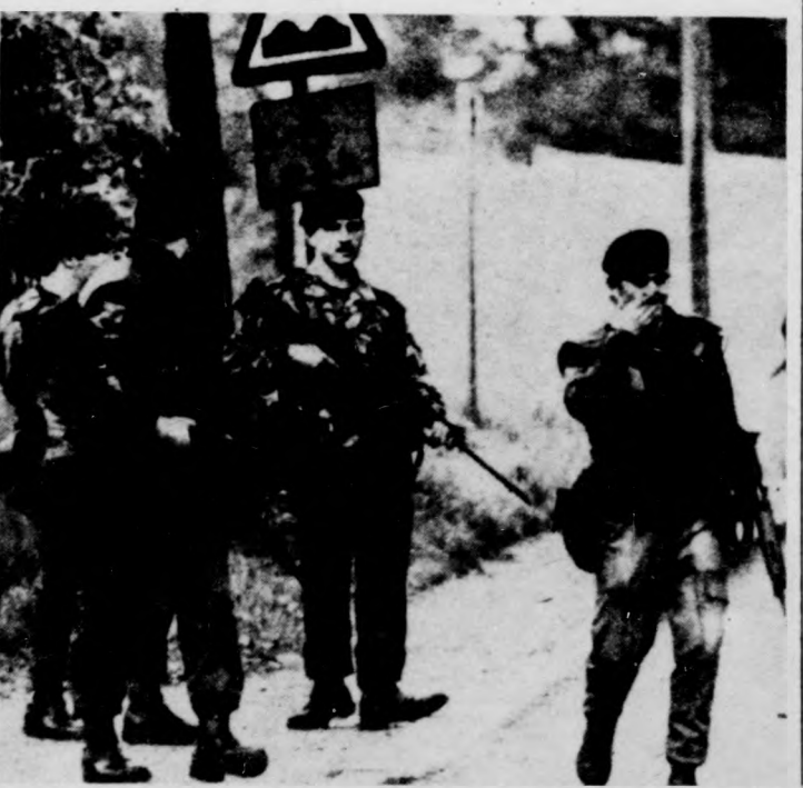
Megfeszített erővel folyik a nyomozás a belföldi megszállásról rabok után. Képünkön: az Észak-Irorszában állomásozó brit csapatok egyik járőröző osztaga