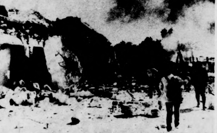
Libanoni helyzetkép: romba dőltek az épületek a Bejrúttól délre fekvő Mreije városkában. A héten kihirdetett tűzszünet sem csökkentette jelentősen a közel-keleti országban uralkodó feszültséget