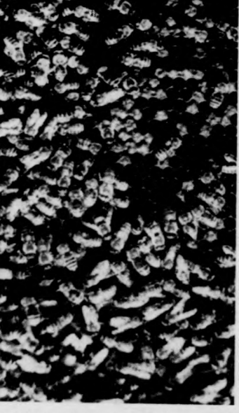
A lépén szorgoskodó méhek

Miután körülnéztünk, megismerkedtünk a méhek és a méhészt életével, hazatértünk Debrecenbe. Nem felejtettünk el azonban magunkkal hozni egy kis mézet és néhány fényképet. Csak él-