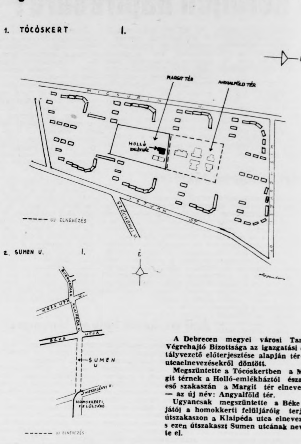
A Debrecen megyei városi Tanács Végrehajtó Bizottsága az igazgatási osztályvezető előterjesztése alapján tér- és utcaelnevezésekről döntött.

Megszüntette a Tócsókertben a Margit térnek a Holló-emlékházról északra eső szakaszán a Margit tér elnevezést — az új név: Angyalföld tér.