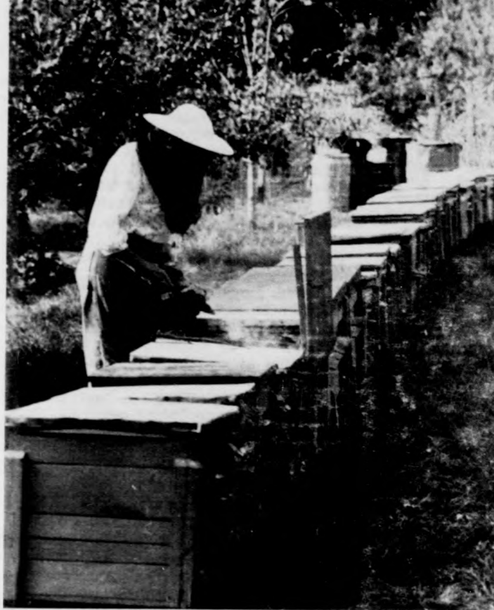
A kaptárt füstölővel érdemes megközelíteni

Ugyancsak megszüntette a Béke útját a homokkerti felüljáróig terjedő útszakaszon a Klaipea utca elnevezést, s ezen útszakaszt Sumen utcának nevezte el.