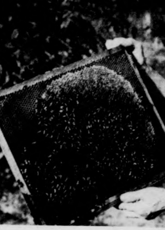
A méhsaládokat rendszeresen kell vizsgálni