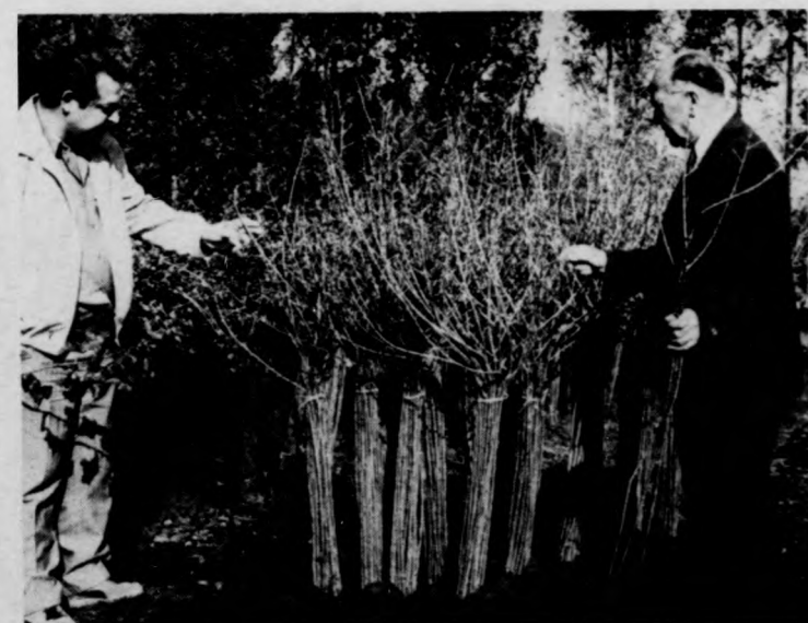
Jostatövek szállítás előtt

cenben kétségtelenül meglévő termelési ambíciót újra fel lehet lendíteni. Egyelőre kis-kerttulajdonosok érdeklődnek iránta, de a Debreceni Konzervgyár is kísérletezni szándékozik vele: Fülöpön megpróbálják a nagyüzemi termeltesét is. A telepen már 214-en dolgoznak.