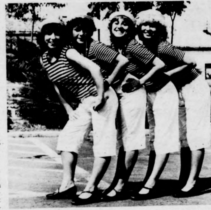
Az Izzó balett „matrózban”