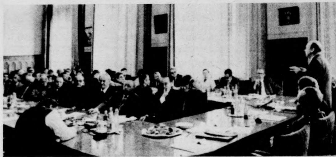
Szerdán ülést tartott az Országos Béketanács Elnöksége a Parlamentben. Az ülésen többek között ismertették az ENSZ leszerelési hete alkalmából hétfőn kezdődő hazai eseménysorozat programját. Képünkön: dr. Várkonyi Péter külügyminiszter szólal fel

Szerdán összeült az Országos Béketanács elnöksége. A tanácskozáson tájékoztató hangzotta el időszerű nemzetközi kérdésekről, valamint az ENSZ-közügyűlés ülészakájának munkájáról. Attekintették a béke megvalósulásának következő feladatait, s ismertették az ENSZ leszerelési hete alkalmából rendezendő akciókat. Az ülésen elmondták, hogy a hétfőn kezdődő eseménysorozat programjában szakértői fórumok, békegyűlések és előadások követik majd egymást. Október 24-én az Országos Béketanács — a TIT