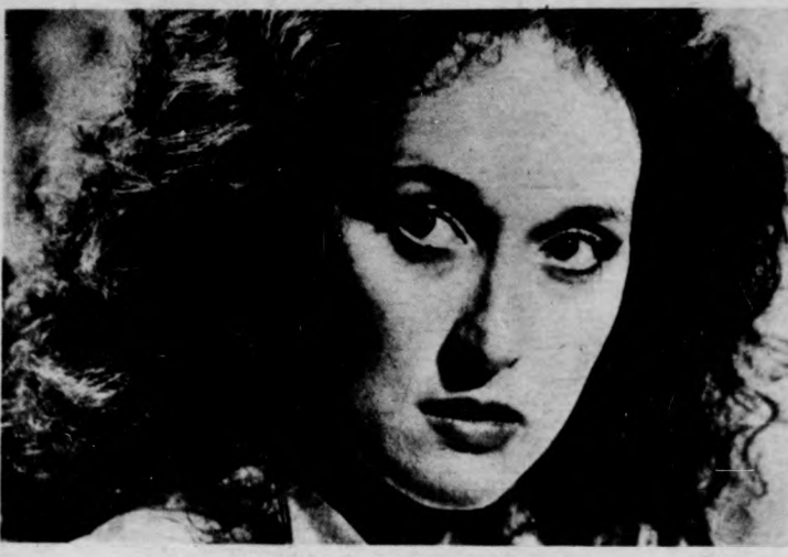
A francia hadnagy szeretője