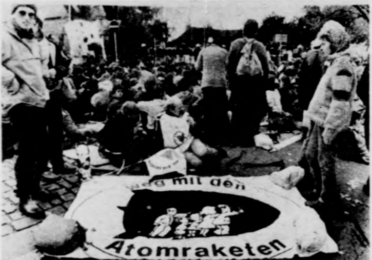
Akciókat rendeztek a nyugatnémet békemozgalmi csoportok. Képfő: az amerikai rakéták tervezett telepítése ellen tiltakozó fiatalok Bremen városában

A KGST ülészakan a lakosság élelmiszer-ellátásának megújításáról, a mezőgazdasági termelés fokozásáról és az exportőr országoknak adandó újabb ösztönzésről is szó esett. Erdemes emlékeztetni Lázár György felszólalására: a magyar miniszterelnök a mezőgazdasági programban is a kölcsönös érdek következős figyelembevételét sürgette. El kell is-