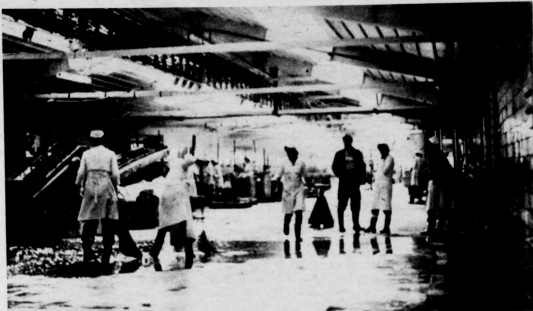
Az első munkacsarnok felében már dolgoznak

A példa valóban tükrözi a szemléletváltást. Meg kell azonban jegyeznünk, hogy a lakóházfelújítás terén is legelőször ilyen hozzáállás szükséges. Nem véletlen, hogy a munka eredményesebbé tételében a tanács végrehajtó bizottsága utasította a vállalat igazgatóját: tekintse kiemelt feladatának a lakóház-felújítást. A komplex vállalkozás akkor érme el igazán a célját, ha végére a lakosság is élvezhetné a versenyztetés gyümölcsét.