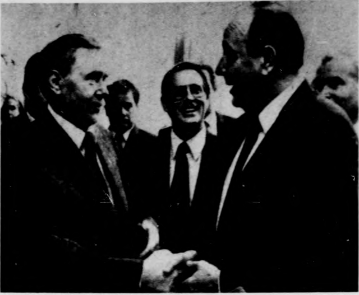
A kelet-nyugati kapcsolatokról és az eurorakéták kérdéséről tárgyalt az osztrák fővárosban a szovjet és a nyugatnémet külügyminiszter. Képfő: Andrej Gromiko és Hans-Dietrich Gensher az egyik megbeszélés előtt

gyüleésekről, amelyeknek a témája ugyanaz: a Pershing-2 rakéták és a robotrepülőgépek rövidesen esedékes megjelenése Nyugat-Európában.