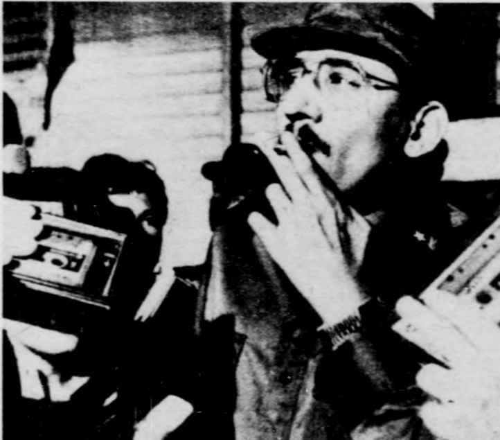
Nicaraguai értékelés szerint fokozódott a közép-amerikai ország fenyegetettsége. Képfő: Humberto Ortega hadügyminiszter nyilatkozik újságíróknak

Egyébként a NATO-szövetségek nem mindegyike lelkesedik a rakétatelepítésért. Az NSZK-ban a héten valóban nagyarányú béketüntetések zajlottak le, megfelelően annak, hogy a közvélemény többsége ellenzi a Pershing-2-k és a robotrepülőgépek nyugatnémet földön való elhelyezését. A jövő héten Hollandiában kezdődnek hasonló tüntetések, tiltakozó akciók. A hágai kormány is megoszlik, a koalíciós pártok közül csak a liberálisok sürgetik a rakéták hadrendbe állítását. A parlament majdani állásfoglalását a mostani békeakciók is nyilván befolyásolni fogják.