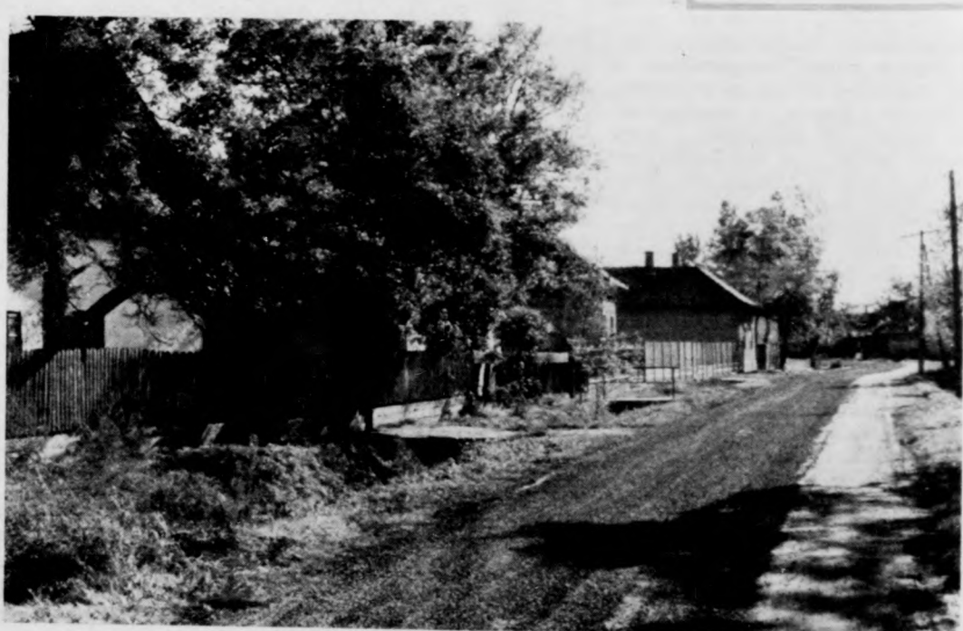
Hagyományos utcácska, felújított úttal