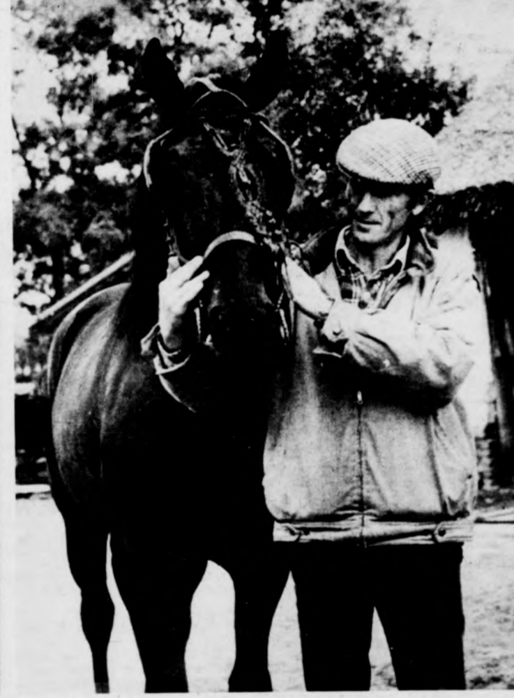
Gyújtóval, a fogat egyik új loval