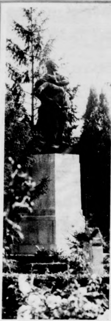
Az első világháború hőseinek emlékét őrzi az emlékmű a község főterén