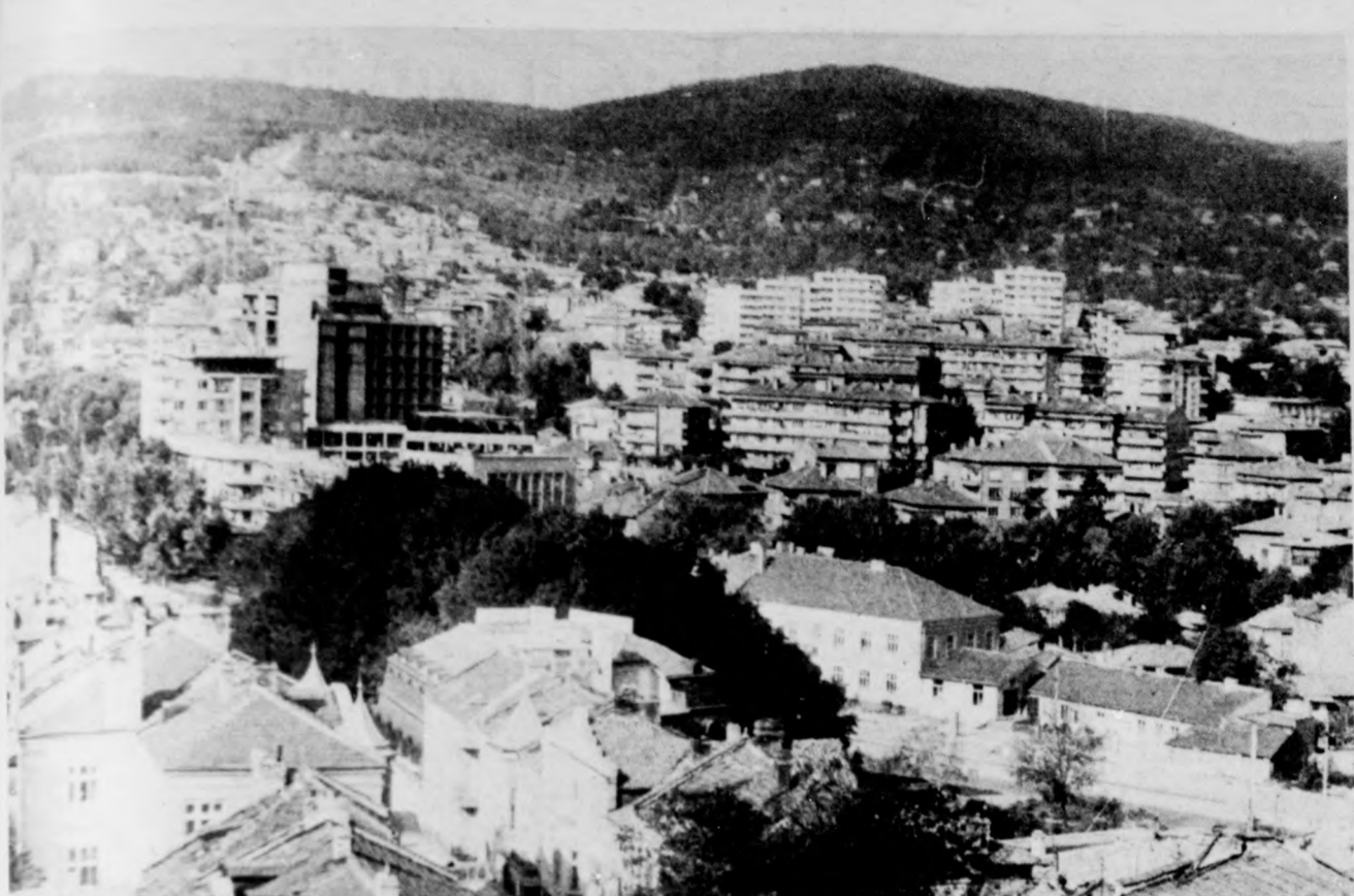
Sumen a hegyek ölelő karéjában