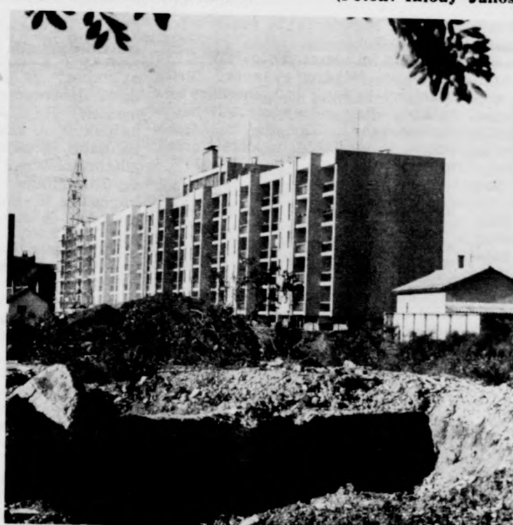
A régi vályogházak helyén új tömbök emelkednek az északi lakótelepen