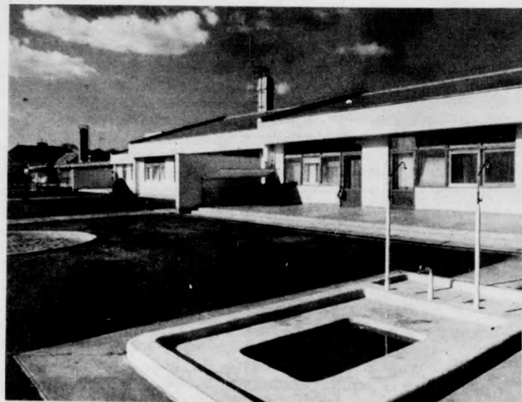
Óvoda és bölcsőde egymás szomszédságában. Utóbbi alig két hónapja adták át