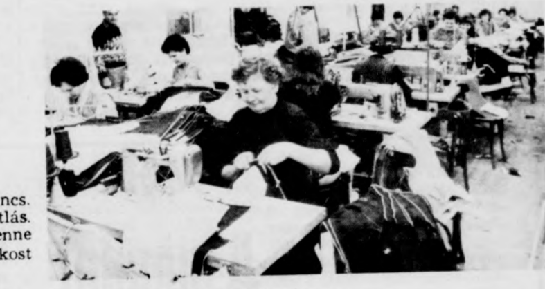
Dorogra nem, Hollandiába igen