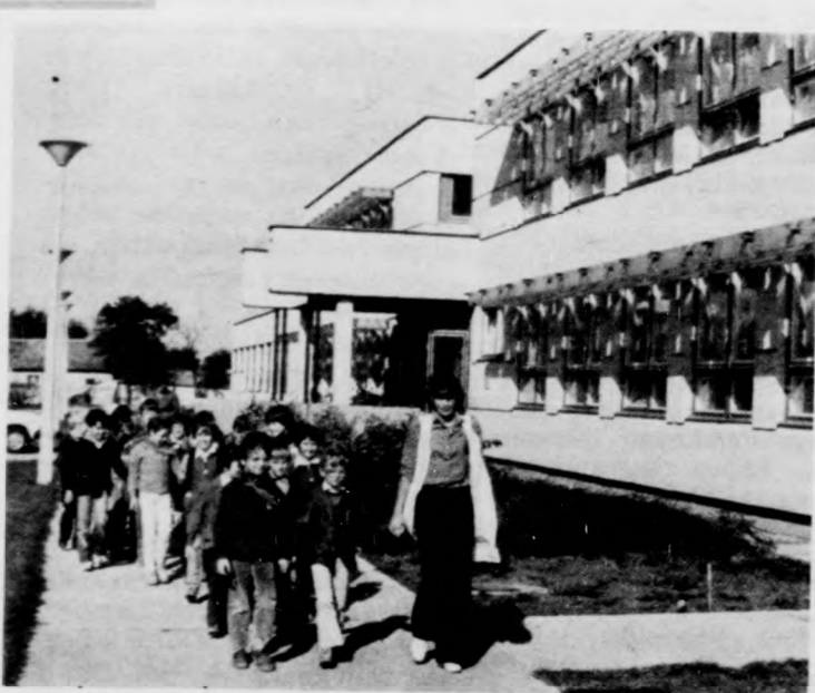
Modern iskolában öröm tanulni