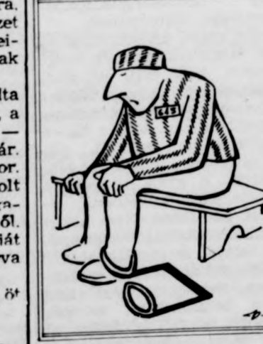
„Rab” — szódlia