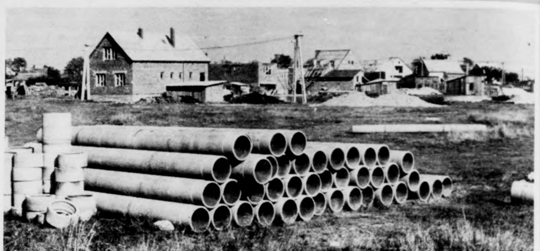
A házak befedése várnak, mindegyik út közművesített