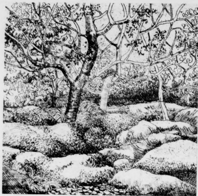
PRIM ZOLTÁN METSZETE