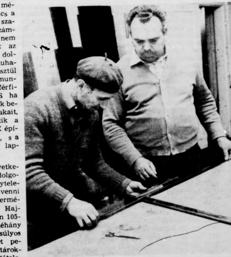
Ez az üvegtábla sem a lakosoknak készült