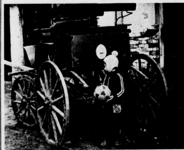
A fogat most az istálló előtt pihen