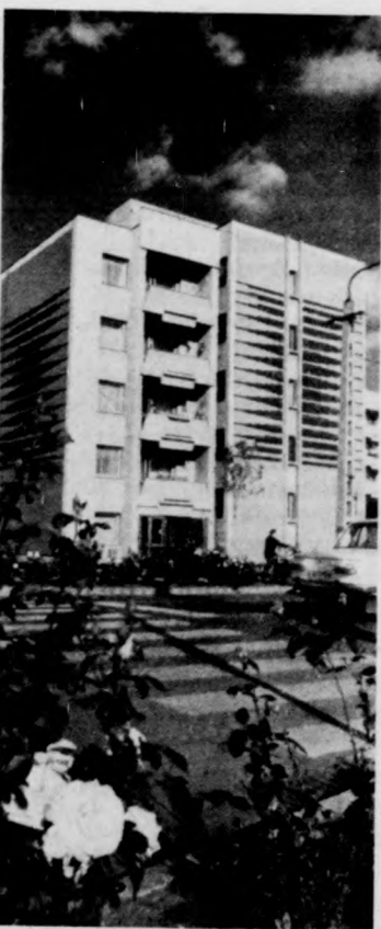
A község egyik legesebb lakóháza