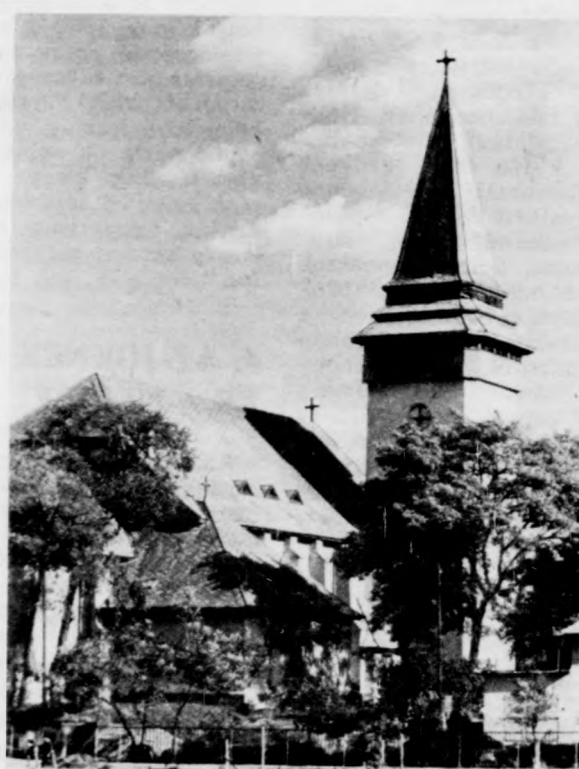
A gondos műemlékvédelem megőrzi az emlékeket

Püspökladány nagyközség, járási székhely. Regionális szerepkörét tekintve középfokú központ, városra fejlődő település. Már újkori, bronzkori és korai vas-kori leletek is igazolják, hogy helyén hajdanán is éltek, de történetéről a legrégebb írott emlék 1351-ből származik. A Nagy-Sárrét jellegzetes települése az évszázadok során többször is elpusztult, de mindig újjáéledt. A XIX. század végén népességének száma meghaladta a 13 ezer főt, jelenleg csaknem 17 ezer az állandó lakóinak száma. 1944. október 12. Püspökladány újkori történelmének nyitánya, a második világháború vége, a község felszabadulásának a napja. A közel-múltban ünnepelték meg a településen a felszabadulás 39. évfordulóját, de kevéssel korábban, szeptember 27-én még nagyobb jelentőségű eseményre került sor.