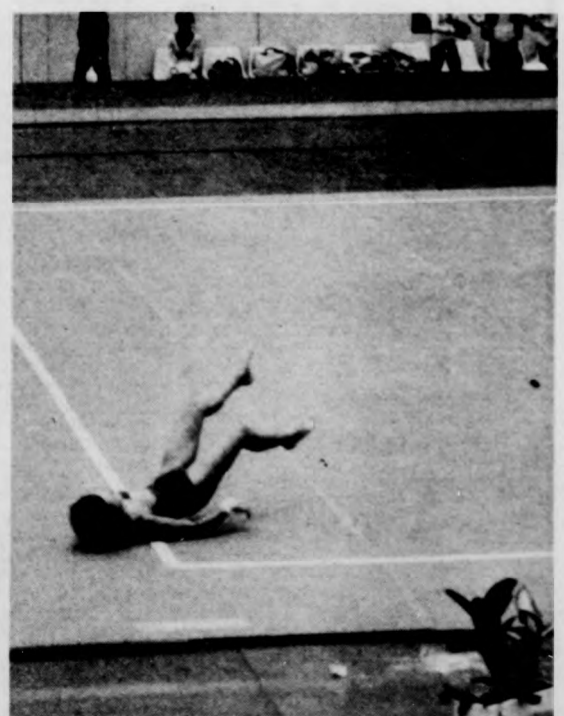
Oda az összetett aranyérem - Maxi Gnauck (NDK) a talajon