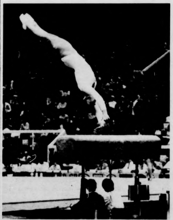
Szerfogatás ugrás közben