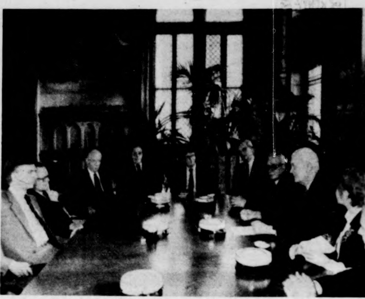
Dr. Trautmann Rezső, az Elnöki Tanács helyettes elnöke a Parlamentben fogadta a hazánkban tartózkodó holland parlamenten küldöttségét.