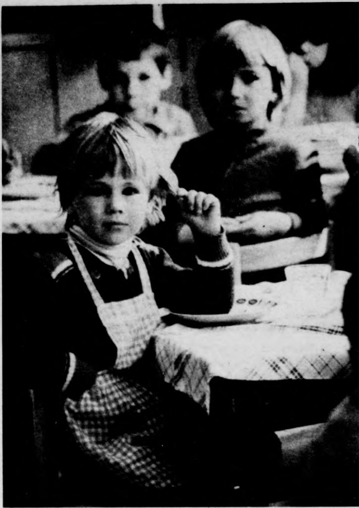
EBÉDRE VÁRVA

Hogy mikor? — erre nincs válasz a professzornak. A legnagyobb gond a tudósok számára az, hogy „józan észsel” ruházzák fel a számítógépeket — de ez még várat magára.