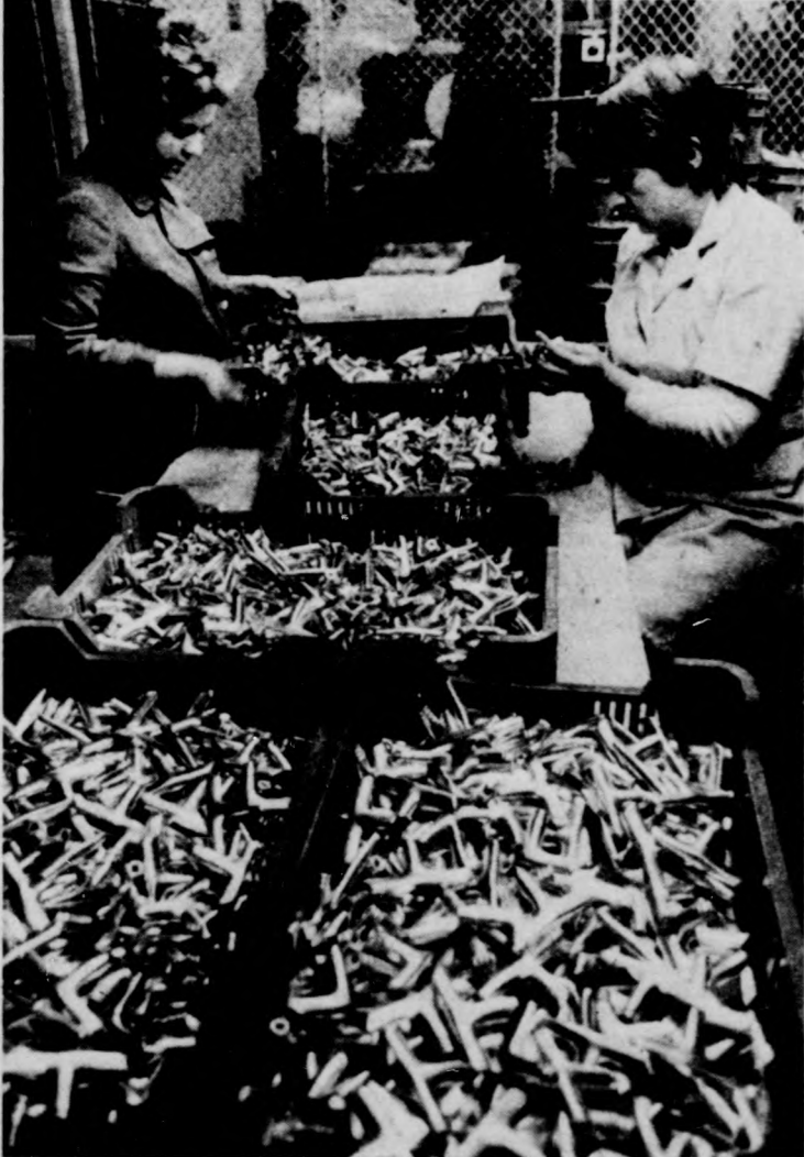
B. L. Minőségi ellenőrzés

— Milyen változást eredményezett a termelésben a beruházás?