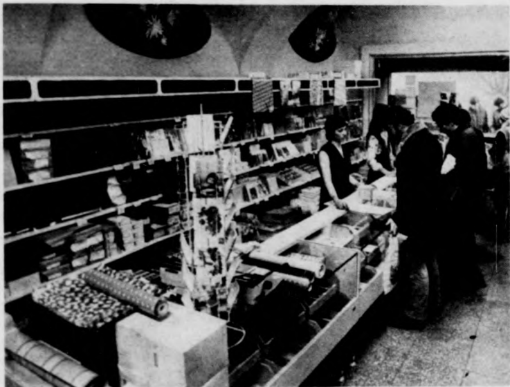
A PIERT és a Hajdú-Bihar megyei Vegyipar-cikk-kiskereskedelmi Vállalat közös üzlete a megszokottnál 40 százalékkal nagyobb árukészlettel várja a vásárlókat

Most kezdődő sorozatunkban az ünnepi áruellátás egy-egy fontosabb területéről szeretnénk hírt adni. Természetesen, hogy a karácsonyfa alá kerülő valamennyi árucikk kínálatával nem tudunk foglalkozni, de sokak számára szeretnénk az ajándékozashoz segítséget adni.