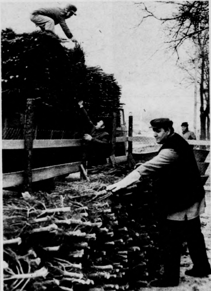
FENYŐFASZÁLLÍTMÁNY ÉRKEZETT DEBRECENBE — KEZDŐDHET A VÁSÁR