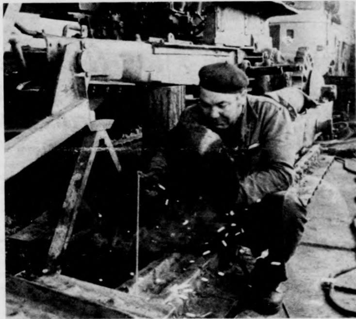
Az erőgépek lánctalpait a debreceni Kossuth Tsz központi gépjavitó műhelyében felújítják, s a felújítással sok ezer forintot takarítanak meg mind a tsz-nek, mind a népgazdaságnak

A hét elején, a karbantartás körülményeivel ismerkedve, újra meggyőződhetünk róla, micsoda kincs —