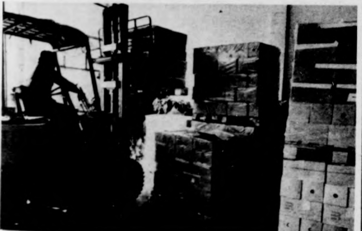
Kurrens áru érkezett: minta nélküli fehér csempe