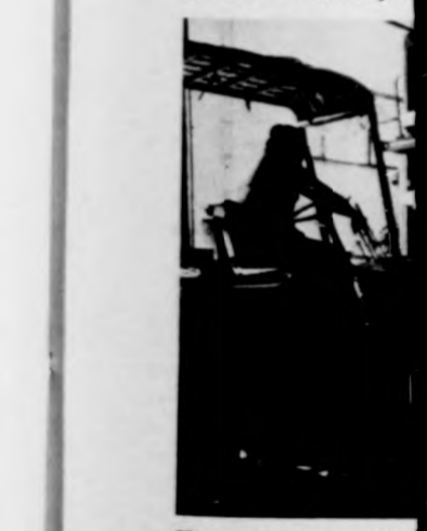
Kurrens áru érkezik a szegedi Panteonban.