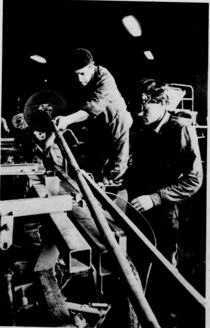
Javítják a RAU cukorrépa vető gépet