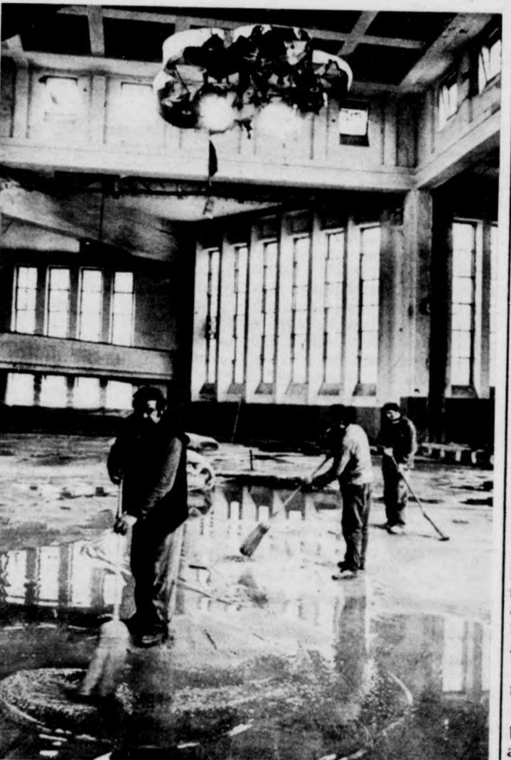
M. I. A munkások a betonlapot go ndozzák