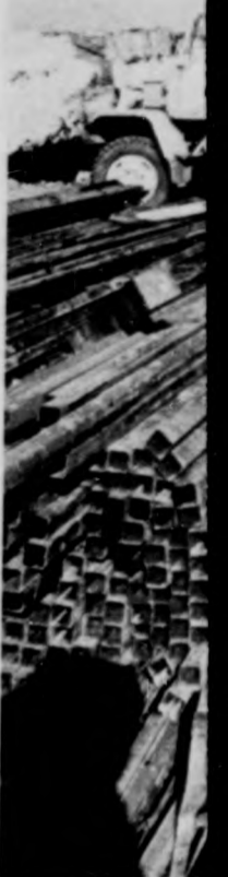
Mintegy 45 millió forint értékű építési munkák kezdődtek a szegedi Panteonban.