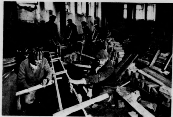
Készül a padlócsatornához a zsalu