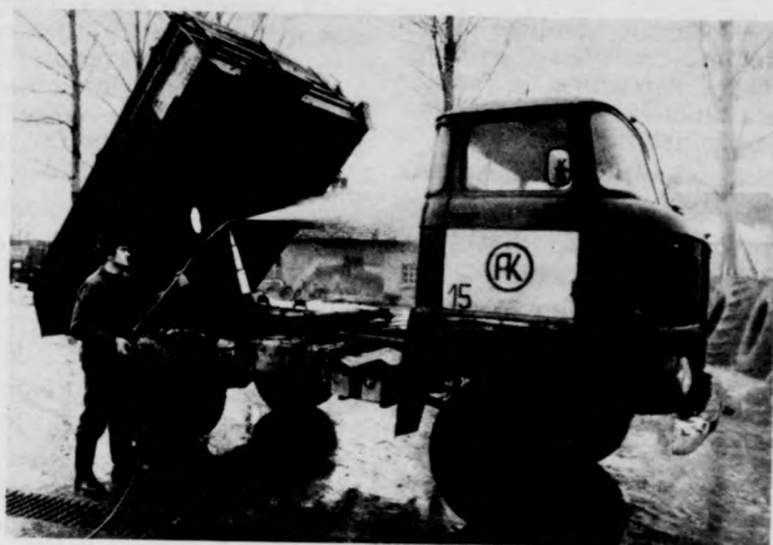
Nagyjavítás előtt alapos mosást kap az IFA