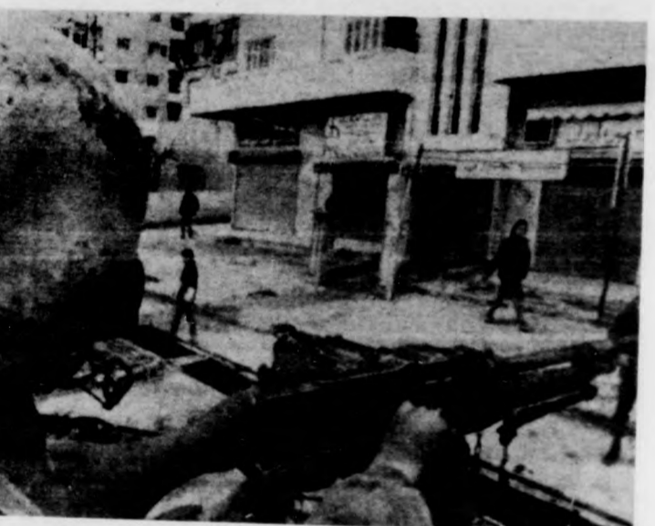
Libanon izraeli megszállás alatti levő részén is fokozódik a feszültség. A képen Szidonban egy izraeli katona tüzelésre kész fegyverrel figyel a járókelőket.