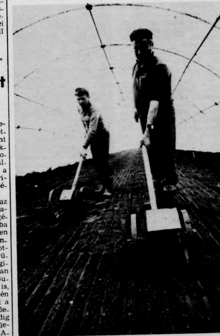
Az eleje már kél, a végét azonban még csak most vetik a paprikának

Az Aeroflot bővítette repülőjártatát; kedden indította első menetrend szerinti közlekedő gépét a Moszkva-Budapest-Málta útvonalon. Ennek kapcsán találkoztak az újságírókkal a szovjet légitársaság képviselői a Ferihegyi repülőtérén. Amint elmondták, az Aeroflotnak, a világ legnagyobb légitársaságának a gépe 95 ország 118 városába jutnak el. Tavaly összesen 109 millió utast és hárommillió tonna árut szállítottak. Evről évre újabb területeket kapcsolnak be a légitársaságba. E programban indították a Moszkva-Budapest-Málta járatot is, amely minden hét kedden közlekedik. Az új útvonal a magyar turistáknak is új lehetőséget kínál; eddig ugyanis csak átszállással lehetett Máltára jutni. A MALÉV jegyirodái megkezdtek e vonalra a jegyek árusítását. (MTI)