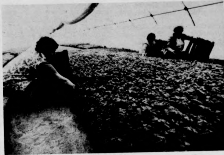
Március elejétől mintegy 400 ezer forint árú palántát értékesítettek a debreceni Béke Tsz kertészetében