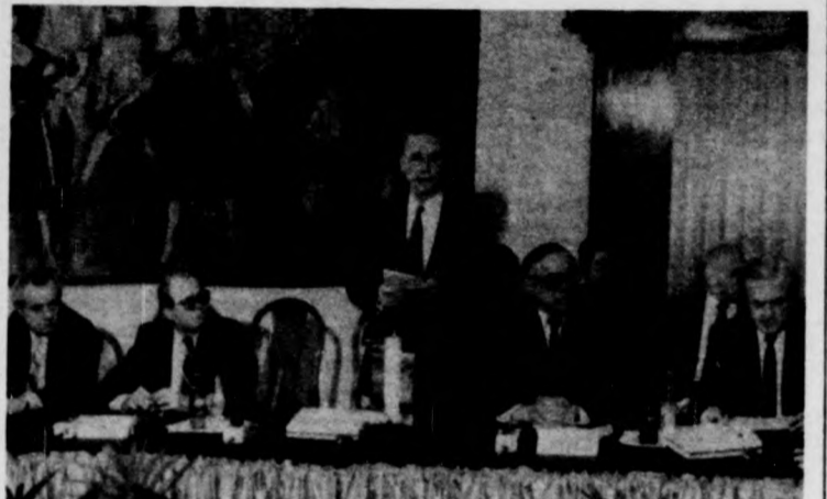
Budapesten tartja ülését a KGST tervezési együttműködési bizottsága. A képen: Lázár György megnyitja a tanácskozást

Az ülésen az 1986—1990. közötti időszakokra vonatkozó népgazdasági tervezési munkák helyzetét és tapasztalatait tekintik át. A tagországok tervező szerveinek képviselői véleményeszerűen folytatnak az előzetesen számitásba vett fejlesztési elgondolásokról és a népgazdasági tervek összehangolásának további feladatairól. (MTI)