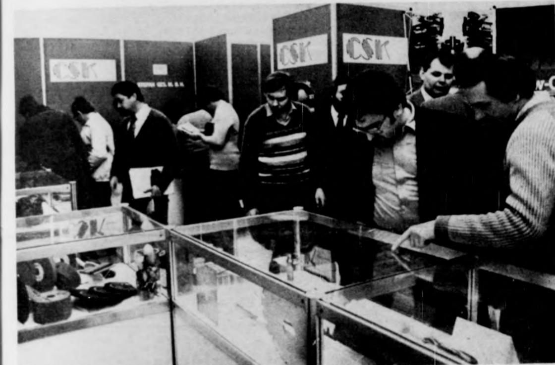
Több, fejlett szerszámgyártással rendelkező nyugat-európai cég is elhozta termékeit a kiállításra