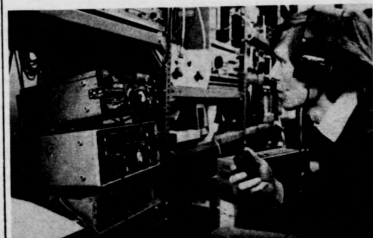
Műszerek a rádióklubban