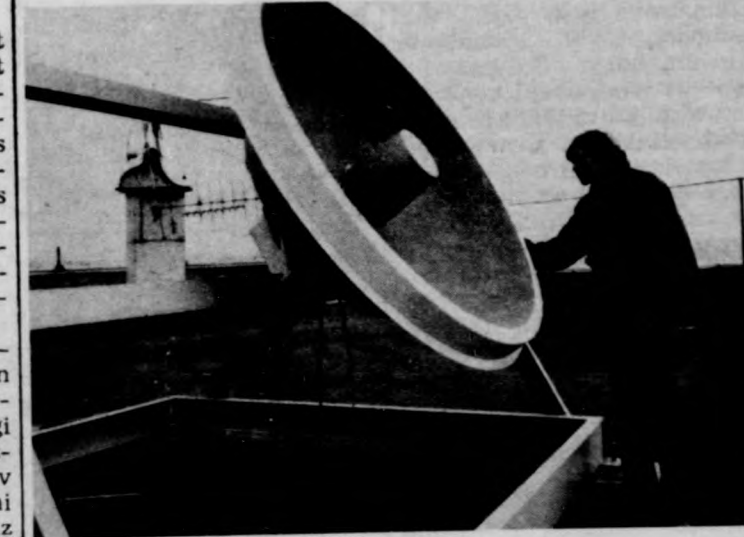
A műhold adását vevő parabolaantenna az egyetem tetején