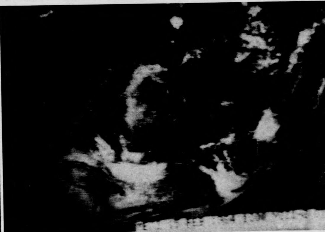
A meteorológiai műholdról érkezett felhőképek egyike

Szintén együttműködés, espedig japán-francia-magyar együttműködés keretében tartózkodik az intézetben dr. K. Ishii, a Sendai Tohoku Egyetemről (Japán). Jelenlegi tartózkodása alatt azokat a közös anyagvizsgálati méréseket készíti elő, amelyeket ez év augusztusi közel egy hónapos debreceni újból ittléte során fognak végrehajtani az ATOMKI Van de Graaff-gyorsítóján. Ezeket a méréseket azután 1985 elején a Tohoku Egyetem ciklotronján folytatják.