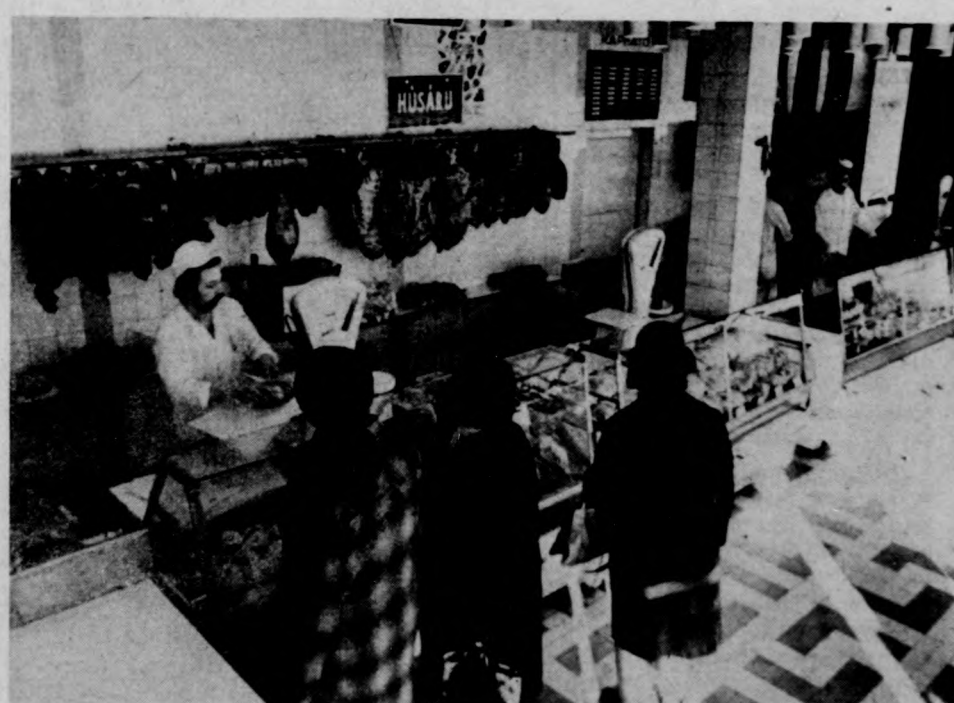
Bő választék a vállalat saját boltjában