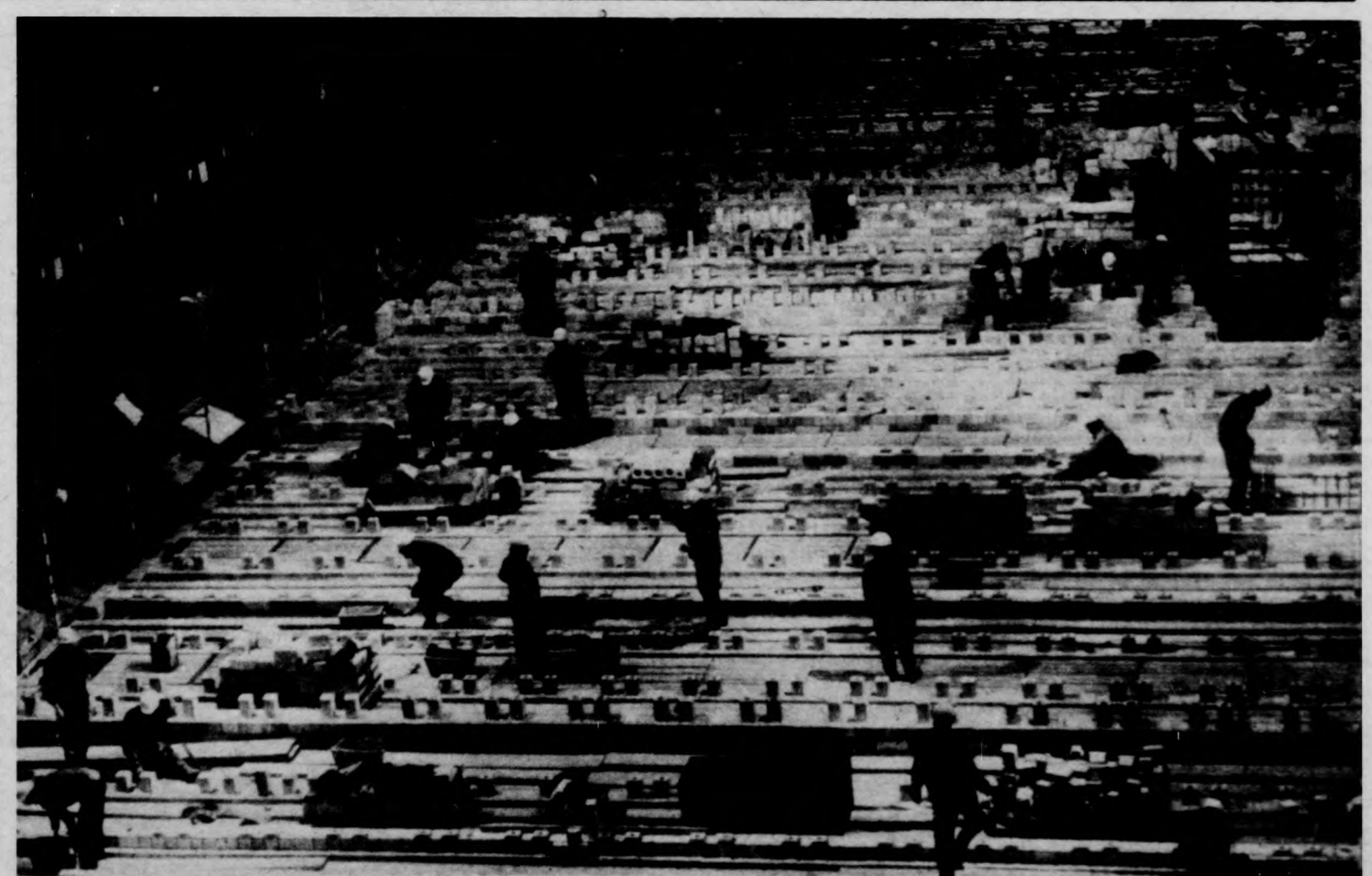
Dunaújvárosban megkezdtek a Duna Vasmű új koksizoblokkjának falazását