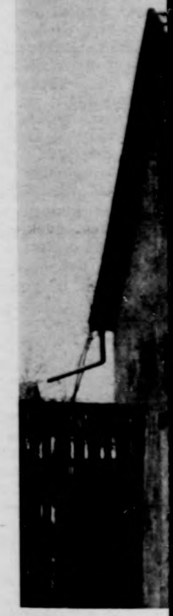
Vass Bálinték új

„A ház nem csak nyugalom” — keletű mondás, a kését nyugodtan hetjük. Jó lenne maradéktalanul és bölcs megállapítás káshánya értékes gitja az otthon, — mert pénz az ára, tehát várak nye kielégítésére, hetősebbek, a mátrabbak építene. Kabán sok a bá bamód nőnek ki zak, amelyek ugye re készítik az ősi zán méretűkkel, se szerkezetükke zöttük a kétszint már a, az idő, ar denki sátorotés, méter alapterület. Kétszintre épült az az iker megállásra bír. A biccenti a fejem, amilyenre azt nem ide kellett v hogy bármelyik lókat érne. — Cs ka Péteré, a kő fié ez az ikerh egyik járókelőlől, megis van a ma telik?” kérdésre benyitok, hátha rú a képlet. Nem — Nagyobbrész lőknek köszönhe de meg is dolgoz méstelenen nem gondolok, amely nál végünk — zódózás után) — ka Ivánné. — H zunk serteszhizal évbén leadunk