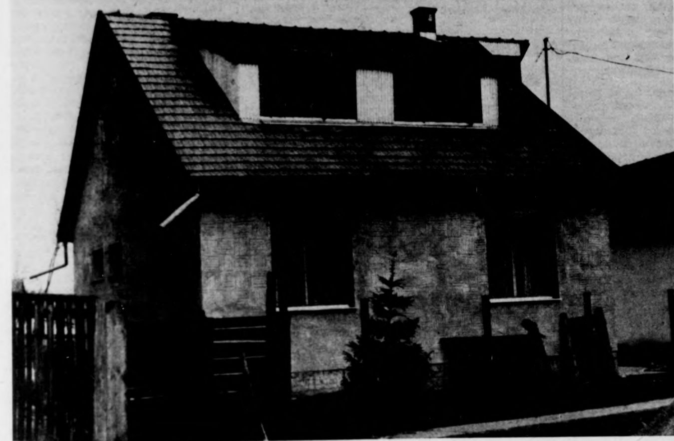
Vass Bálinték új otthona