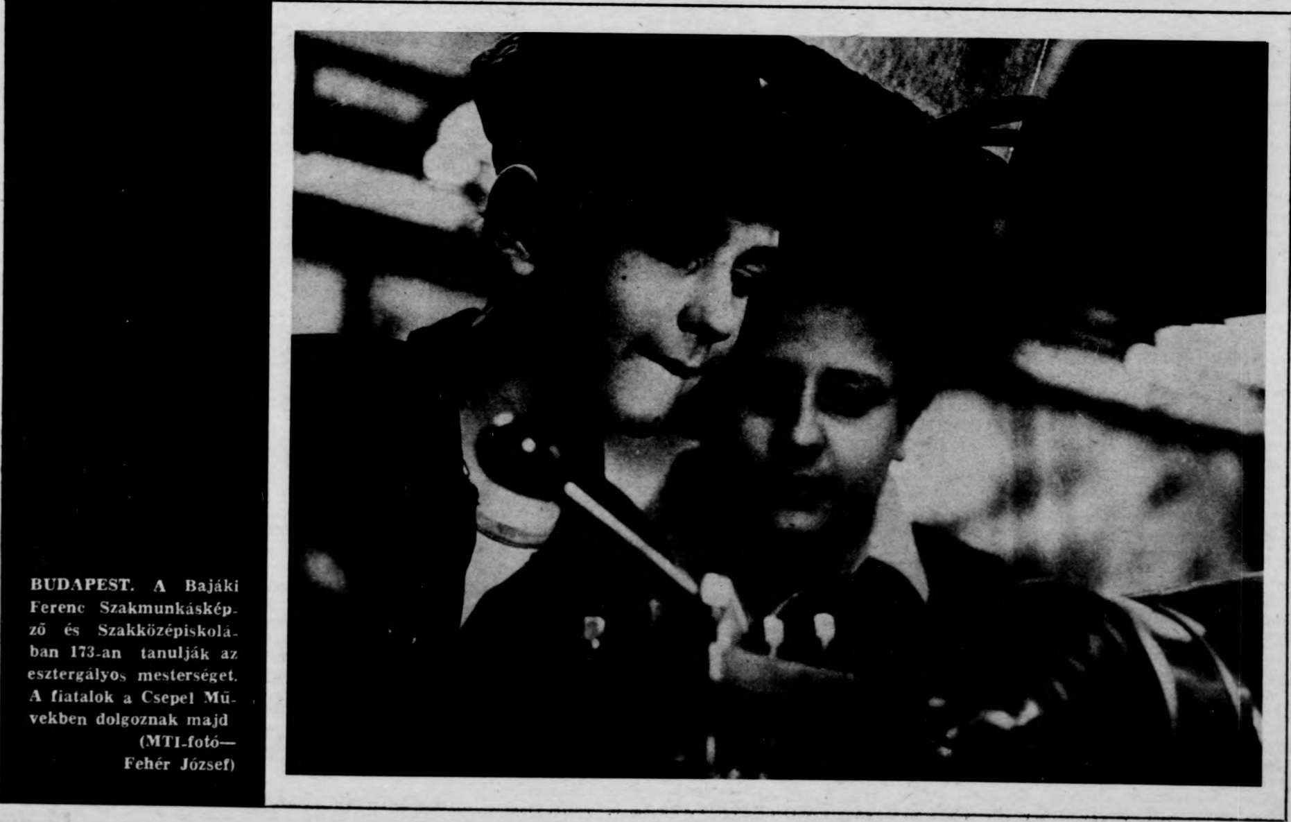
BUDAPEST. A Bajáki Ferenc Szakmunkásképző és Szakközépiskolában 173-an tanulják az esztergályos mesterséget. A fiatalok a Csepel Művekben dolgoznak majd

A teljes foglalkoztatást úgy kell fenntartani, hogy a Miniszter