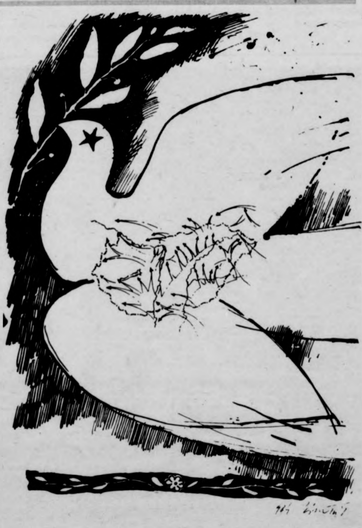
PÁSZTOR GÁBOR RAJZA