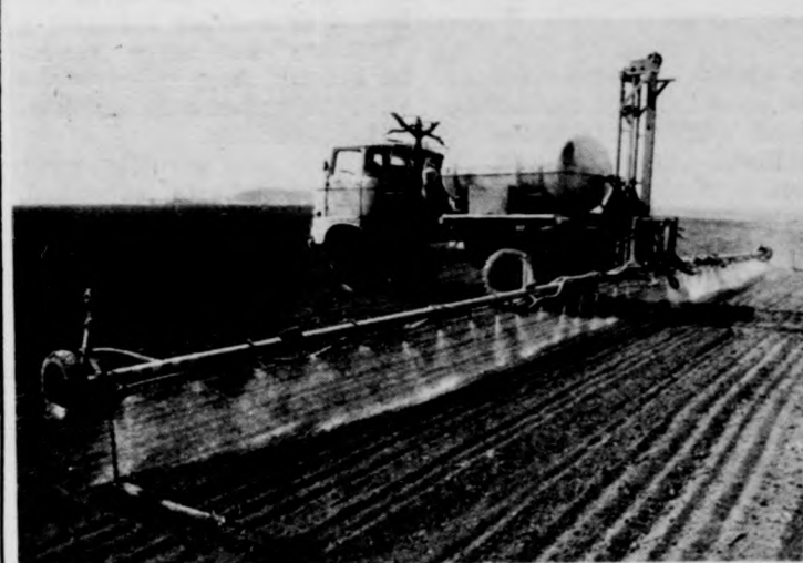
Nagy segítségére van a Dózsa Tsz-nek a Kertitox Globál, az IFA-ra épített permealó, ami egyike a legmozgékonyabb munkagépeknek