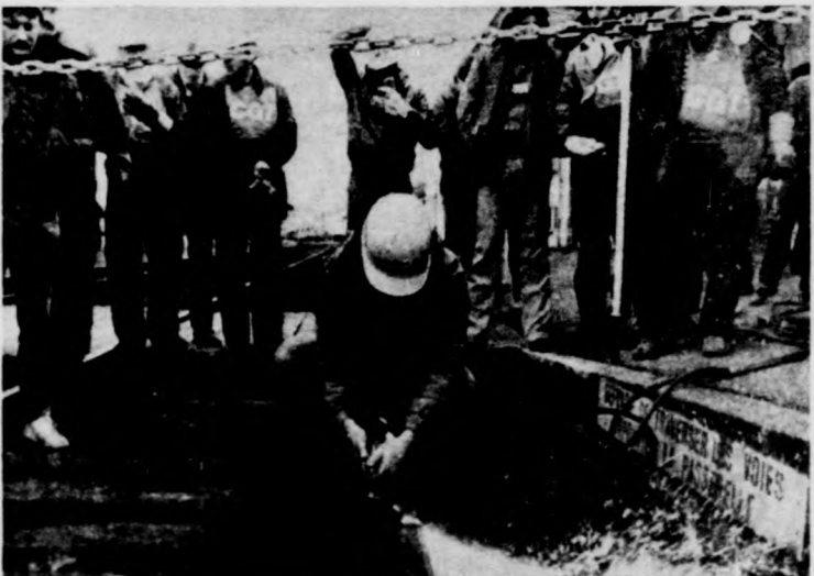
Franciaországban újabb megmozdulásokra került sor a kormány tervezett gazdasági intézkedései miatt. Képünkön: egy vasúti sztrájk Longwy város pályaudvarán