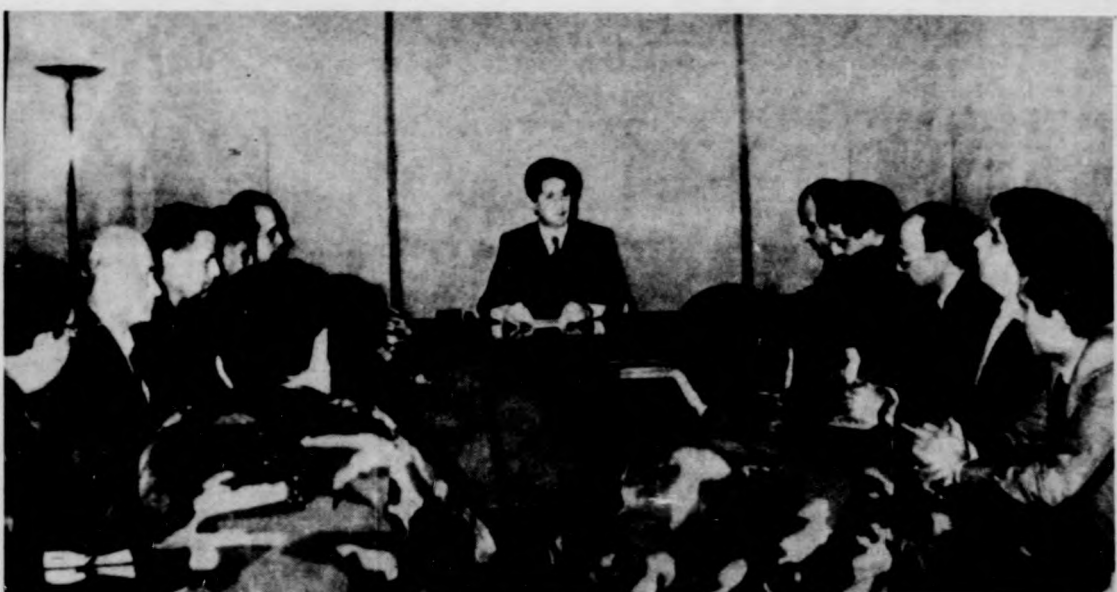
Változatlanul feszült a helyzet Libanonban: nem szűnnek az összecsapások Bejrútban és a főváros környékén. Képünkön: Amin Gemajel elnök (középen) vezetésével tanácskozik a tűzszünet betartását vizsgáló bizottság