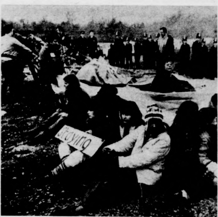
Akcióba lépett a brit rendőrség a Greenham Common-i katonai támaszponton, ahol hosszú hónapok óta tart az amerikai rakétatelepítést támadó asszonyok tümegyűlése