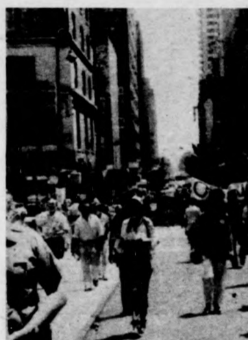
Mintegy 15 ezren tüntettek New Yorkban a Reagan-kormányzat közép-amerikai politikája ellen