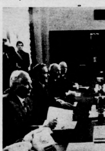
A hét elején Moszkvában tárgyal a nicaraguai küldöttség. A képen: Kongsztantyin Csernyenko (balra) fogadja a nicaraguai delegációt, amelyet Daniel Ortéga vezet

Egy-egy ország helyi képviselői választásai nem képeznek nemzetközi méretű eseményt, a lengyel tanácsválasztásokra azonban odafigyeltek Európában s a kontinensen kívüli is. Ennek oka a földalatti ellenzék kihívása volt: felhívással fordult a lakossághoz, hogy bojkottálja az urnákat, s így jelezze: a konszolidáció nem halad előre. A felszólítás kudarcot vallott, s a lengyelek háromnegyede szavazott az új törvény alapján, amely mindenütt kötelezővé