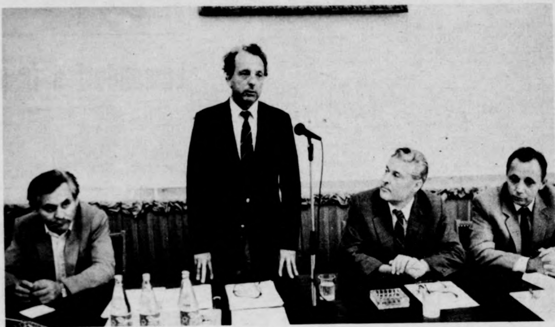
Az ipari miniszter tájékoztatójában az ipar jelenlegi helyzetéről és az ágazatra váró feladatokról beszélt

MEGYÉNKBE LÁTOGATOTT DR. KAPOLYI LÁSZLÓ IPARI MINISZTER