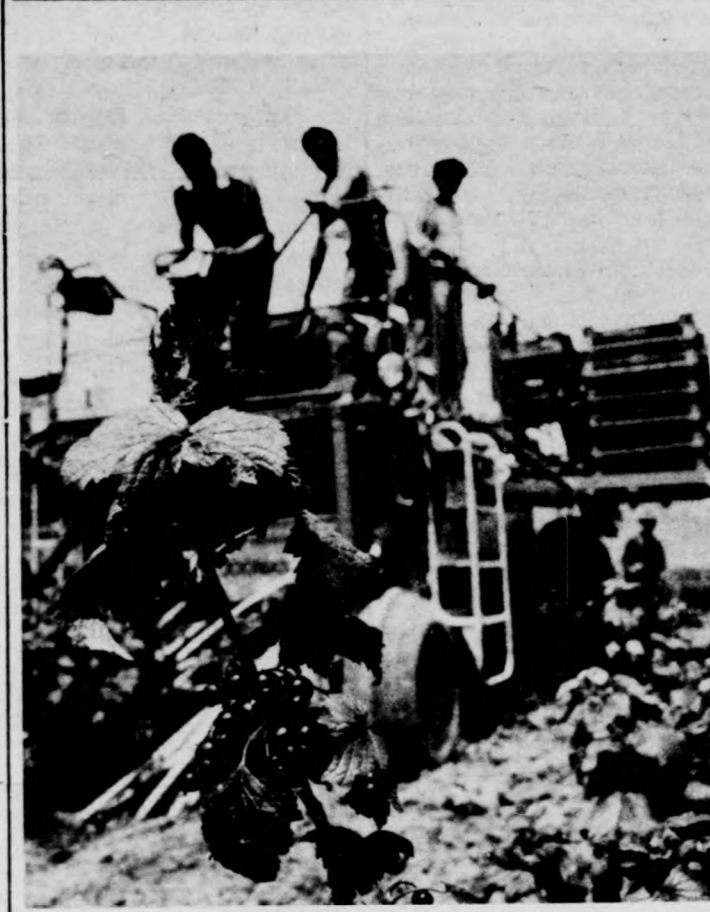
RIBIZLISZÜRET — GÉPEL

A megyei adatokon kívül a kötet nemzetközi adatokat is közöl, és a publikált mutatók összehasonlítási lehetőséget nyújtanak a KGST-tagországok, valamint az egyéb — fejlett mezőgazdasággal rendelkező országok termelése között. (KS)