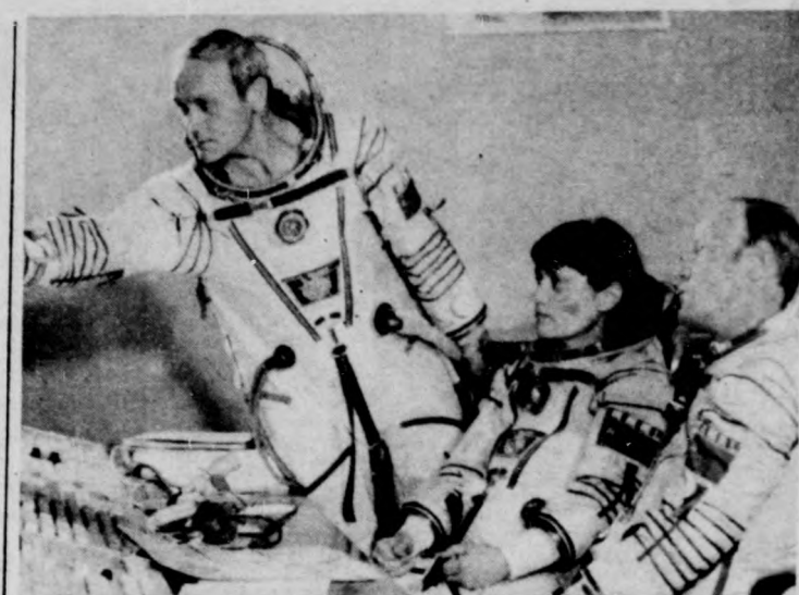
A Szovjet T-12 űrhajó legénysége: Vlagyimir Dzsanzibekov, Svetlana Szavickaja és Igor Volk

szerven rejlő lehetőségeket igyekeznek kihasználni. A tervszerű gazdálkodás szempontjából ugyanakkor kívánatosnak tartja a miniszter az irányító szervek és a vállalatok közötti viszony megbizhatóságát, magyarán az utólagos, visszamenőleg érvényes szabályok kiküszöbölését. Dr. Kopolyi László szövege az energiagazdálkodás kérdéseiről, valamint az egyes ágazatok legfőbb gondjairól, feladatairól. Az egész ágazat számára kulcskérdés a gépipar nagyobb teljesítménye, aminek alapvető feltétele a technológia korszerűsítése, a műszaki fejlődés gyorsítása. Elemzések mutatják, hogy évente a gyártott termékeknek mindössze két százaléka tekinthető új cikknek, ezek közül is döntő részt képviselnek a saját fejlesztések. Márpedig nemzetközi példák igazolják, hogy a dinamikus gazdaság vezetője a külföldi eredmények (termékek és technológiák) gyors meghonosítása, esetleg továbbfejlesztése.