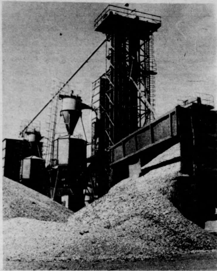
Most a szárítók kapacitása határozza meg a munka ütemét

Eppen ez a tény — mármint a magas nedvességtartalom és az emiatti lassabb betakarítási ütem — inspirálta az üzemeket arra, hogy idén növeljék az úgynevezett nedveskukorica-tárolás mennyiségét. Ez az utóbbi időben elterjedt a megyében. Nem csupán azért, mert a kukorica tárolásának ez egy energiatakarékosabb módszere, hanem azért is, mert a tapasztalatok szerint kedvező takarmánynak bizonyult, az állatok szívesen fogyasztják. E nedves tárolási módszerrel tudtak a természettel ügymond taktikázni az üzemek: Nagy a nedvességtartalom? Lassabban halad a betakarítás? Akkor növeljük a nedvesen eltett kukorica mennyiségét, s mégiscsak megemeljük a napi betakarítási mennyiséget! Idén tehát 90 ezer tonna kukoricát tároltak így ezzel a módszerrel, s ez a megyénk üzeimében az összesen szükséges kukoricatakaromány mennyiségének több mint 30 százaléka.