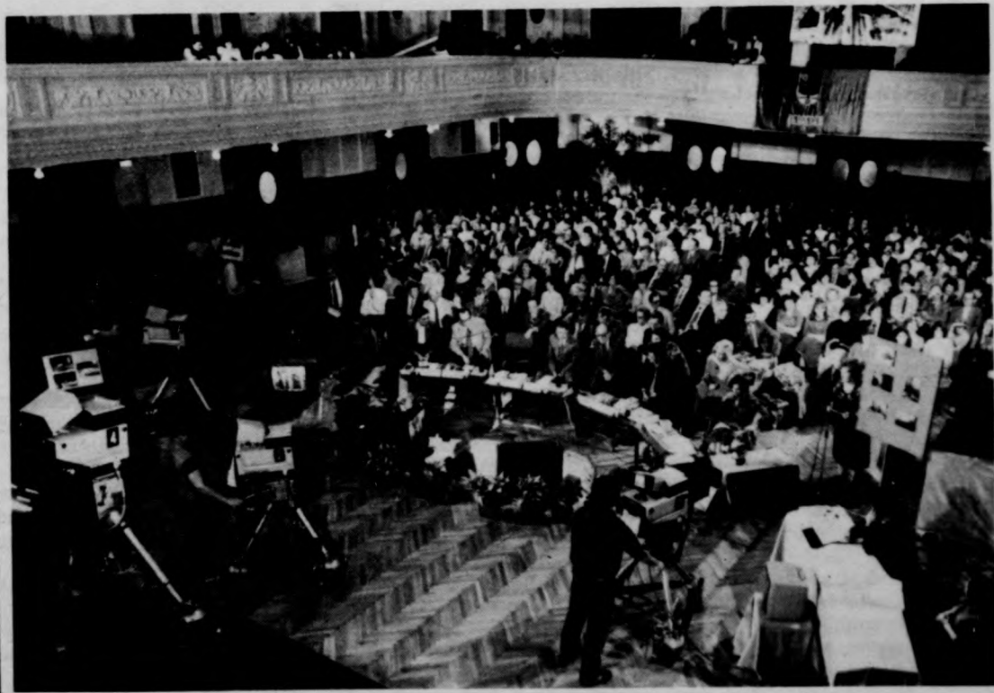
Kamerák, versenyzők és érdeklődők a Bartók termében (Fotó: Vencsellej István)

Ez jó mulatság, férfi (illetve női) munka volt! A Szalmadúsító című vetélkedősorozat első adásában, pénteken este szép sikerrel debütált Debrecen: remek hangulatú versengéssel 83 százalékos teljesítményt ért el a háború befejezését követő első évtized kulturális-művészi jelenségeinek ismeretéből. A Straky Tibor vezette hat tagú csapat kitett magáért, a legtovább kérdésre maximális pontot szerzett. Ebben természetesen része volt a sok tudás segítőnek és a lelkes támogatóknak is. Vegre korrekt, színvonalas és igényes vetélkedősorozatral rukkolt elő a televízió; olyan műsorral, amely valóban hasznára válhat játékosoknak és nézőnek. A Bartók termében (Fotó: Vencsellej István)