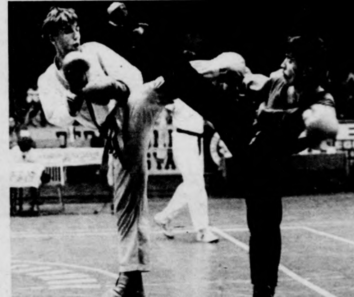
Egy jogoszláv és egy magyar versenyző csatája