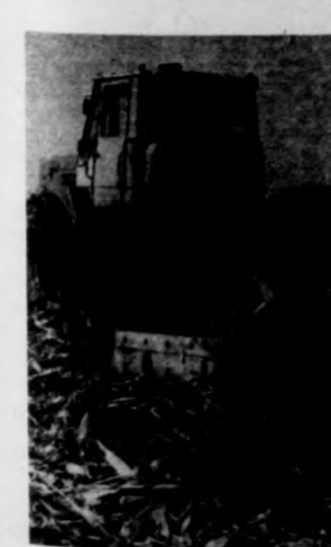
Bizony még mindig magas a víztartalom

Egyébként a gond a kukorica betakarításánál a növények magas víztartalma miatt adódik. Ez határozza meg a betakarítás ütemét. Ugyanis valamennyi kukoricát szárítóra kell vinni, mert a nedvességtartalmuk a 22 helyett 28, néhol 30 százalék. Betakarítógép-kapacitás van az üzemekben, a jelenlegi napi teljesítményt duplájára is tudnák növelni. Am a szűkös szárítókapacitás ezt nem teszi lehetővé. Ezért a szárítók teherbíró képességéhez kell igazítani a munkát, s az ütemet.