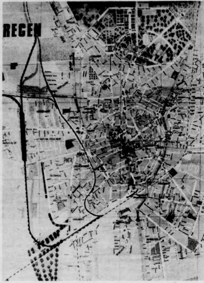
DEBRECEN TÉRKEPE: UTAK ÉS VASÚTVONALAK

Vízválasztó. Erdemes beolvasni. Az első igazi nagy alku. A vasút ajánlata itt még csupán az, hogy hajlandó a banktól a felújítás fedezetét, kb. 70 millió forintot bankkölcsön gyanánt felvenni és a városnak átadni, keretként. Hosszas