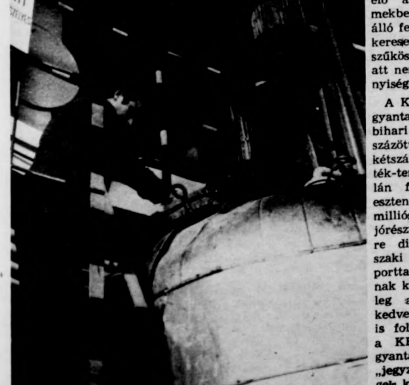
Ellenőrzik a tartály tisztaságát

A KEMIKÁL Építési Műgyantagyárnak két hajdúbihari üzemében összesen százötvenen dolgoznak. A kétszázmillió termelési érték-terv elmaradásánál talán fontosabb, hogy az idei esztendőre „megcélzott” 25 millió nyereséget elérik. Ez jórészt az utóbbi időben egyre dinamikusabbá váló műszaki fejlesztésnek, az importtal való takarékoskodásnak köszönhető. Remélhetőleg a népgazdaság számára kedvező tendencia a jövőben is folytatódik, s előbb-utóbb a KEMIKÁL Építési Műgyantagyára is a jók között „jegyzett” gazdasági egységek közé kerül.