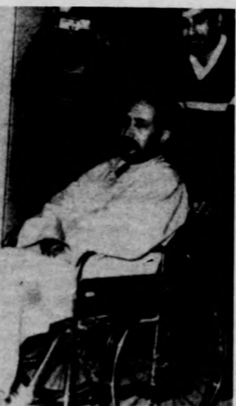
Tolószerződésben gőrdítik el az egyik kimerült utast

Az iráni biztonsági erők vasárnap este megrohadták a teheráni repülőterén vesztéglő kuvaiti utasszállító gépet és kiszabadították a túsokat — jelentette az IRNA iráni hírügynökség. Ezzel véget ért az a drámai gépeltérítési akció, amely — a korábbi jelentésekkel ellentétben — nem négy, hanem két emberéletet követelt. Az a két kuvaiti, akiknek kivégzését korábban bejelentették, valójában csak megsebesült.