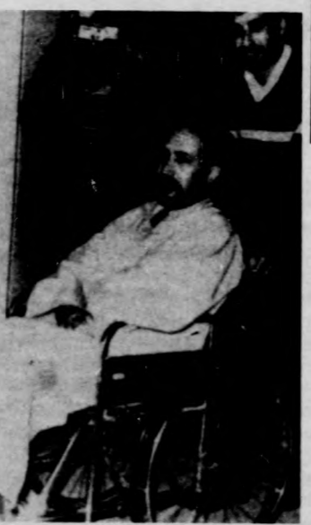
Tolószekben gördítik el az egyik kimerült utast

A teheráni külügyminisztérium szóvivője úgy nyilatkozott az IRNA hírügynökségnek, hogy az akcióit csak akkor rendelték el, amikor szertefoszlott a békes rendezés minden reménye. A tervet az iráni külügyminiszter helyettese előzőleg megvitatta Kuvait, Szíria, Száid-