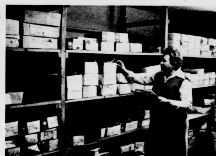
A tranzitraktár most sem üres

A pártdemokrácia gyakorlatának másik területe ma, a vezetőségek újjáélesztése.