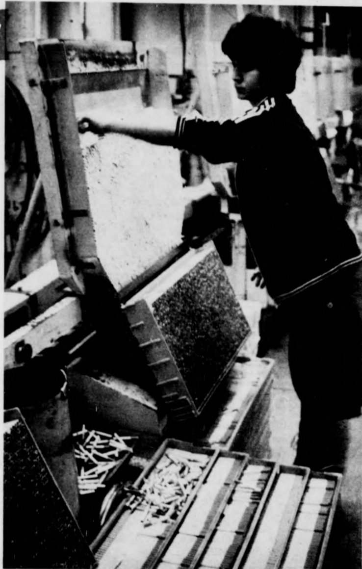
Az új esztendő első heteiben is folyamatos a termelés

Az elmúlt esztendőben sikeresen gazdálkodott a Debreceni Dohánygyár. A terveket kisebb-nagyobb mértékben túlteljesítették és összességében 6,6 milliárd darab cigarettát állítottak elő. Az előző esztendőhöz viszonyított termelési növekedés megfelel az ország többi dohánygyárában elért fejlődésnek, a debreceniek azonban egy területen az átlagnál lényegesen jobb eredményt értek el. Nyereségük 70 millió forint körül várható és ez jelentős mértékben meghaladja a tervezettet is.