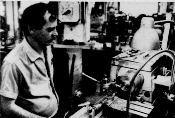
A dohánygyárban a társvállalatoknak alkatrészeket is gyártanak

Az év kezdete több szempontból újdonságot is jelent a Debreceni Dohánygyárnak. A napokban kell dönteni, hogy melyik bérszabályozási formát válasszák, s hamarosan meg kell kezdeni a vállalati tanács kialakításának előkészületeit is. A beruházási tervet is napjainkban beszélik meg a gyár vezetői, s ebben egy különlegesség is helyet kap: a gyártókapacitás bővítésével az éjszakai munka csökkentésére törek- sznek.