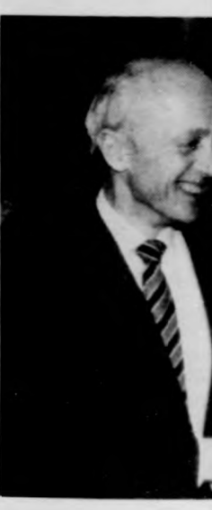
Kaare Willoch és v