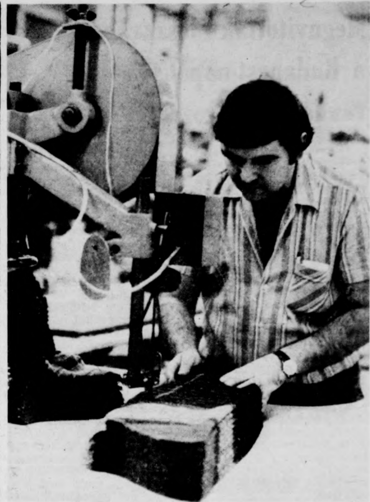
A takarékos anyagfelhasználás egyik döntő fontosságú munkahelyszíne a szabászat

Az idén is kiemelt feladat a népgazdasági tervekben előirányzott 74-75 ezer lakás, s ebből állami erőforrásból 11 ezer, magánérből 63-64 ezer új otthon felépítése. Az állami építőipari vállalatok 33-34 ezer, a szövetkezetek mintegy 3 és fél ezer lakás átadásával számolnak. A nagy ipari vállalatok és me- zőgazdasági üzemek saját