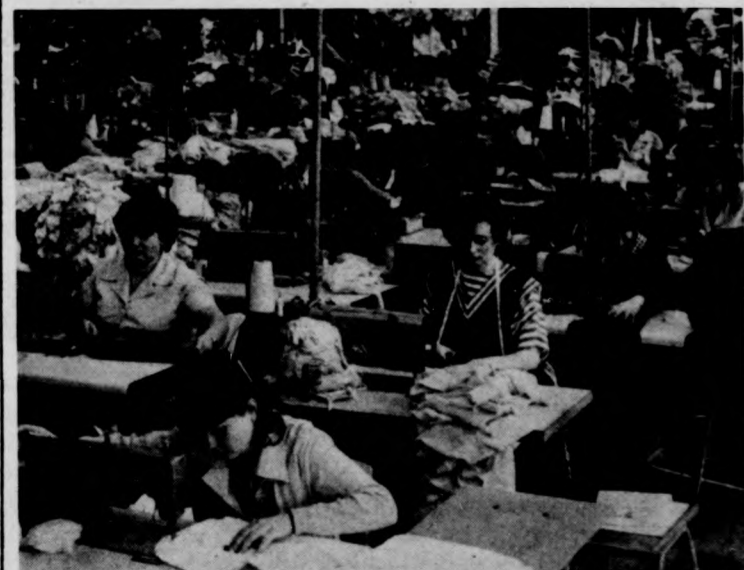
Ezekben a napokban többnyire szovjet piacra készülő termékeken dolgoznak a varrodában.

1984-ben egy konvertálható export árualapot bővítő be- ruházást is végrehajtottak a vállalatnál, mégpedig úgy, hogy a beruházással kapcsola- tos kötelezettségek mara- béktalesan eleget tettek. A fentiekből ítélve joggal mondható, hogy a Debrece- ni Kötöttárgyár erősen ex- portorientált vállalat. Ezt támasztja alá az idejéig terv is, amely szerint az öt százalé- kal növekvő termelés csak- nem 70 százalékban exportra irányul. A terv a tőkés és a szocialista export növelésével egyaránt számol. Ujabb be- ruházás nem lesz, bár a ter- melő alapok — lizing formá- ban — 1985-ben is bővülnek.