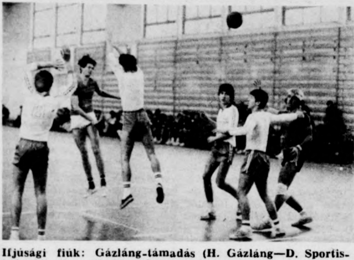
Ifjúsági fiúk: Gázláng-támadás (H. Gázláng—D. Sportiskola 14—13)

A téli termékéklabda Napló Kupában is elkezdtek az 1985-ös esztendő küzdelmeit — a megyei szakszövetség rendezésében. A Mechwart András Gépipari Szakközépiskola sportszarnokában kerül sor az ötletes küzdelem sorozatra, melynek első fordulóját szombaton és vasárnap bonyolították le. A nőknél és a férfiaknál is nyolc-nyolc felnőtt, illetve hat-hat ifjúsági együttes használja fel ezt az alkalmat is a tavaszi bajnoki idényre történő felkészülésre. Az első fordulóban lejátszott 14 mérkőzés közül öt eldöntetlen eredménnyel zárult, köztük a Kábai Egyetértés—Nyiregyházi Tanárképző női összecsapás is. A teljes eredménylista. Nők. Felnőttek: Hajdúböszörmény—Balmazújváros 9—9. Férfiak. Felnőttek: Balmazújváros—D. Spartacus 20—17, Hajdúböszörmény—D. Sportiskola 22—22, Berettyóújfalvai MSE—Püspökladányi MÁV Egyetértés 19—19, Hajdúnánás—Hajdúszoboszlói Gázláng 26—18. Ifjúságiak: Hajdúböszörmény—D. Kereskedelmi Szakközépiskola 16—15, Hajdúböszörlői Gázláng—Debreceni Sportiskola 14—13, D. MEDICOR—Gépipari Szakközépiskola 42—11.