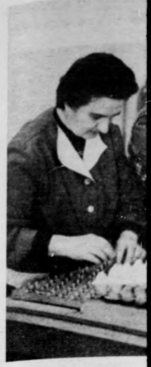
CSIRKÉK DERECSKAI Udvari Vörös Csillag kedően jó, 97 százalék velnek tovább, a töát. A nagy hideg sötétevezető elmondott jó előre, már a nyáron a 22—24, a csibés a vizzel takarékos munkaműveletek jobbtást a csúcsidőben. Htésével és újra feltojások osztályozására