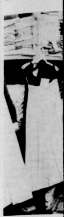
Nagy forgalmat b

— Problémák? zet vissza Csonka Hajdúszoboszlói Szolgáltató Szövetke. — Vannak. — sely nem múlt el Persze ebből nem le azt a következő megye déli rész szövetkezetben olyan gondok, a mottevoen b gazdálkodásukat, nyességüket, hisz szolgáltatás barmtában tevékenylen nyereséges t sem lehet biztos.