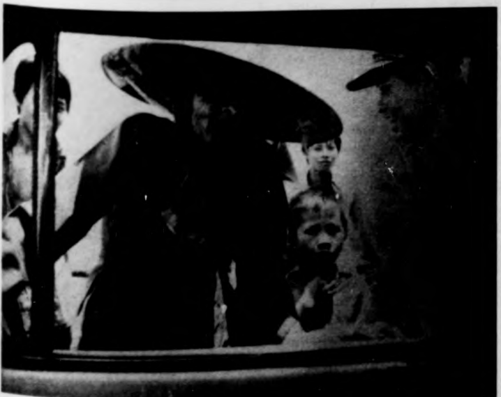
Alkalmi árusok hada veszi körül a gepkocsikat