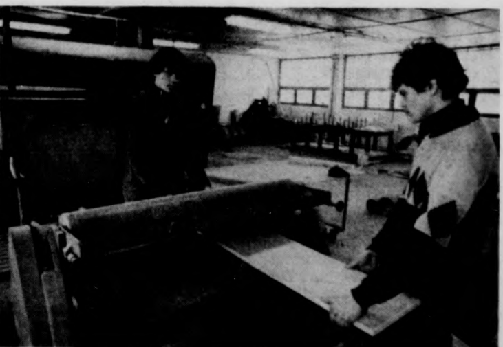
1984-ben indult a munka az új üzemvezéprészen