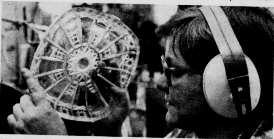
Zaj ellen — fülvédő