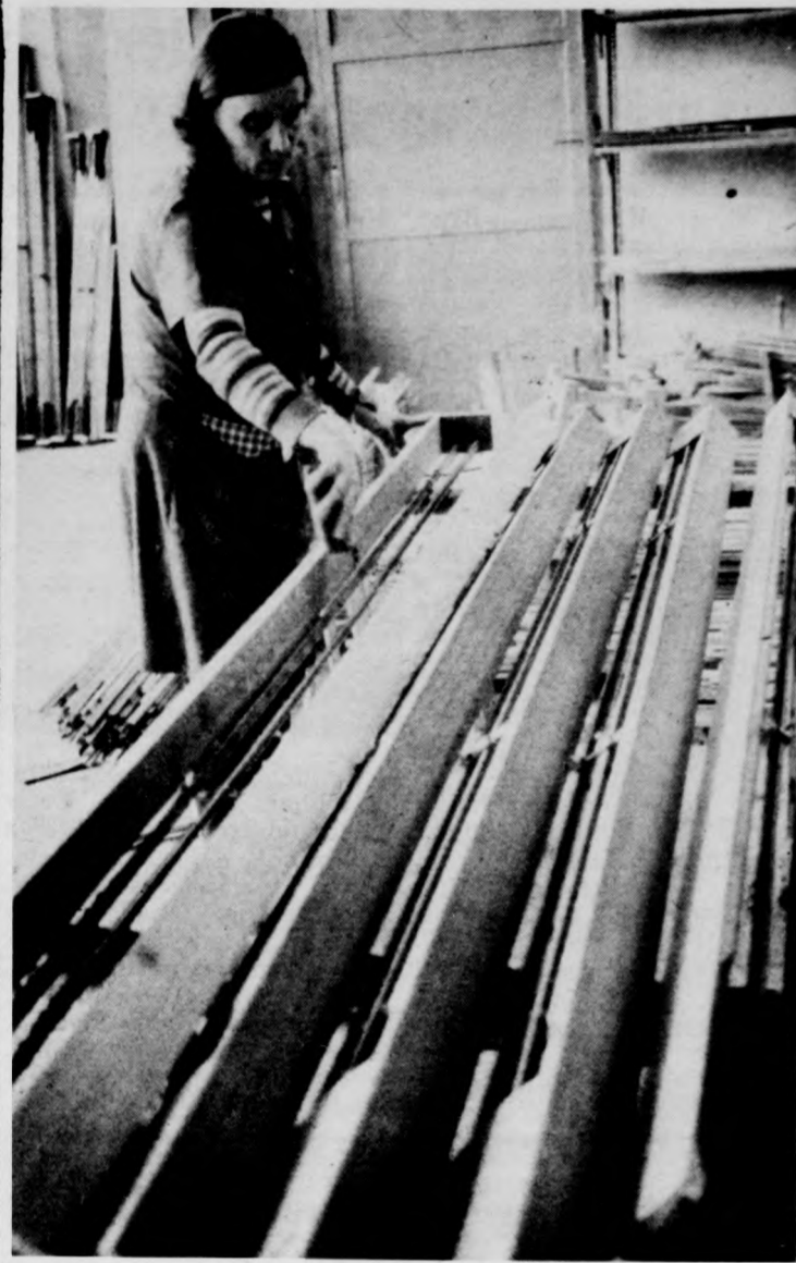
Keresett termék: a függönykarnis összeszerelése

Az eddigi 10 bár helyett 6 bar nyomáshoz konstruált termécsaládot kezd forgalmazni idén a Hungária Műanyag-feldolgozó Vállalat debreceni gyára. A kisebb települések közművezetékének nyomócsöveiként használatos újfajta pvc-csöveket — amiknek a piaci bevezetése az idő tájt kerül sorra — tavaly nyáron kezdték kifejleszteni és decemberben kezdték el gyártani. Szakmai vélemény szerint a 6 bar nyomásra történő tervezés és gyártás tökéletesen megfelel a hazai viszonyoknak, ugyanakkor a kész termékek így 30 százalékkal kevesebb anyagot tartalmaznak, mint a korábban készült, 10 baros csövek. A műszaki fejlesztési kísérlet eredményeként született 6 baros pvc-csövek a gyártó ígérete szerint olcsóbbak lesznek. Forgalmazásuk az év második felétől várható.