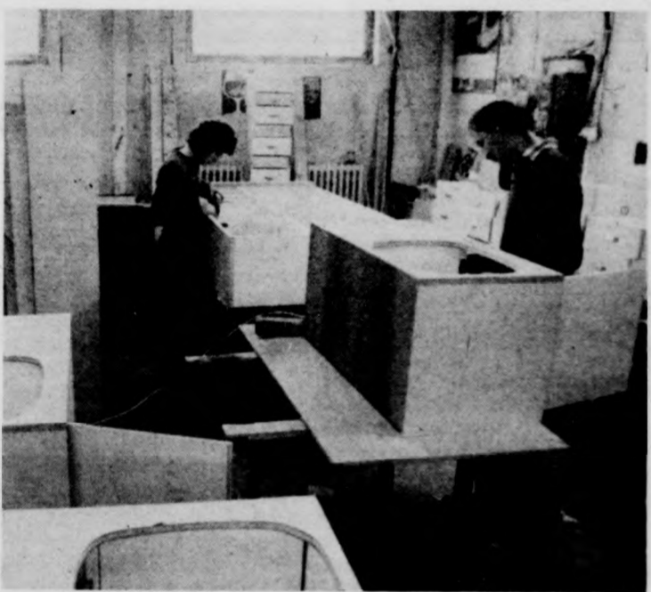
A Szovjetunióba készülő mozgó röntgenbuszok berendezéseit is a szövetkezetben készítik