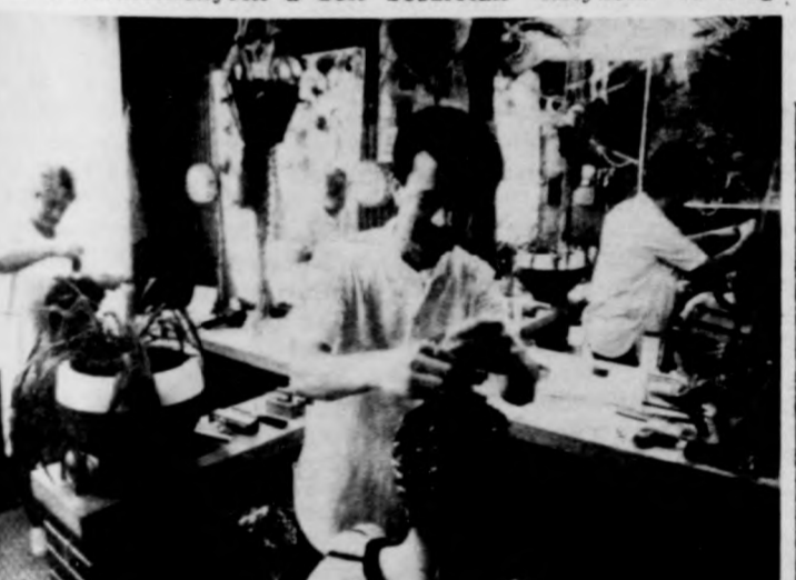
Ez egy vendégszalagoló szerződéses fodrászüzlet

Jelenleg a szolgáltatások közül egyelőre a fotósoké a legeredményesebb, és jelentősen használt cikk forgalmazása is. A megye déli részén eddig már 12 használt cikket árusított boltot nyitottak meg, melyek eredményesen működnek. A jelen s a jövő azonban még ennek ellenére sem biztos. Az igaz, hogy az árbevétel s a nyereség növelésével számolnak, ám ennek a valóra váltása nemcsak a szövetkezetek ügyességén, hanem a lakosság pénztárcájának laposodásán is múlik. Az, hogy ahol lehet, csökkentették az adminisztratív létszámot, nem elég az eredményességhez. De még az sem, hogy a központi berfejlesztés elvei számukra az irányadók a bér-elosztásánál, tehát a berfejlesztési lehetőségük nem a teljesítményüktől függ, s így dolgozóik szívesebben maradnak a szövetkezetben. Ezek csak adalékok lehetnek egy jobb minőségű, magasabb színvonalú, általános szolgáltató hálózat megteremtéséhez. Az elnökszállan egységeket üzemeltessen. Pár évvel ezelőtt, mikor megszűnt az árkiegészítés némely szakmában, a szoboszlóiak helyzete is meg-