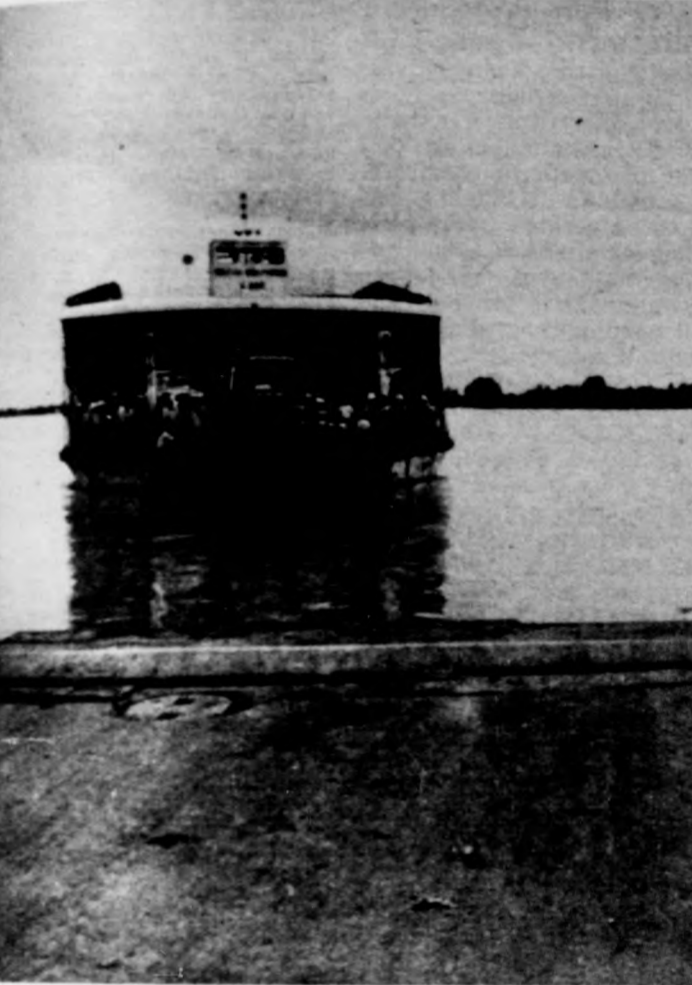
Mindjárt kiköt a komp

Csattannak az inas, naptól, a pársz, szórt fénytől feketeire aszalt testü komphajósok vezényszavai. A tihányi rév átkelő kompjára hasonlító, csak annál sokkal na-