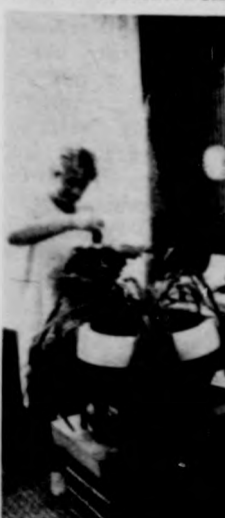
Ez egy vendégcsal

Mert gondolju egy átlagos kerek kasszony napj kiadásából mit szór. Természetesen szolgáltatásokra szekeret, amelyek toznak szorosan tartáshoz. Mondjuk havonta járt foc kéthavonta koz akkor ezen túl es második hónapba fodrászhoz és koz még ritkábban. V a tisztítóba hordt mütét mosatni, s maga mos és vasa kicsi sokra megy. rek igenis me hogy mire adják zen megkeresett. En nem mondom, denki okosan tá dik, de az igazs hozzátartozik, h csak az tud takar dalkodni — meg a ban is —, akinek De térjünk vissza tató szövetkezethe Megyénkben a központi irányelve felelően két szöve a gesztora a szol nak. Hajdú-Bihar szén a bősörmény