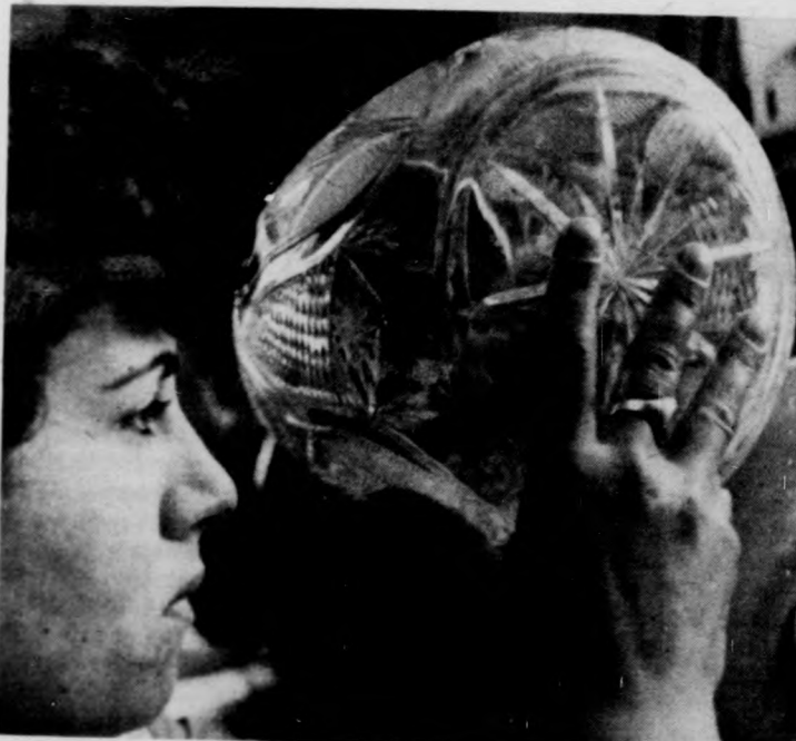
Csillagmintás váza — készülében

lizált virágmintákat alkotnak kompozíciókká az értő kezek, formálódnak a tervezők kristályba metszett álmai. Kis létszámú, csupán 55 dolgozót foglalkoztat a derecskei üzem. A csiszolók között csupán két férfi szakmunkás van, a többi ügyes kezű lány, asszony. Saját nevelésű a szakmunkásgárda, képzésükéről részben Budapesten, részben pedig helyben, az AMFORA Vállalat mesterei gondoskodtak. Tavaly 601 fajta terméket állítottak elő 13 millió forint értékben. Ez az összeg 800 ezer forinttal haladta meg a tervezettét. A többleteljesítmény nagymértékben köszönhető az aranykoszorús Kossuth Szocialista Brigád jó munkájának.