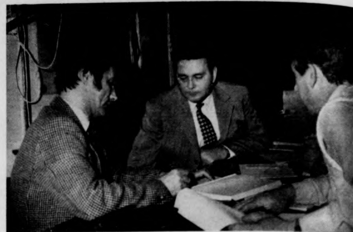
A balmazújvárosi párt- és tanács vezetők szimulált helyzetek parancsnoki-vezetési tervét dolgozzák ki a pv-oktatáson

A megtartott gyakorlatok bizonyítják, hogy a polgári