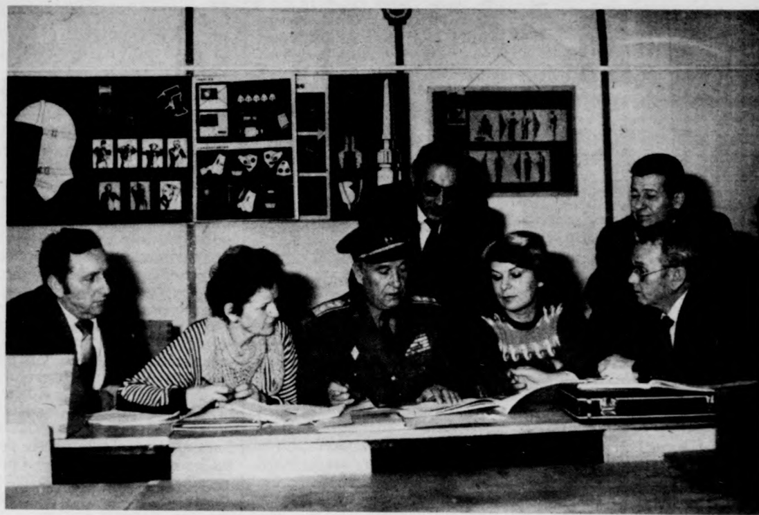
A hajdúnánási városi pv-parancsnokok a megyei pv-törzsparancsnokokkal együtt tanulmányozzák a szakanyagot

Az elmúlt évben a különböző szintű parancsnokságokból, a parancsnoki és személyi állományból 80 fő kapott kitüntetést, 689 fő részesült különböző szintű dícséretben és jutalomban.