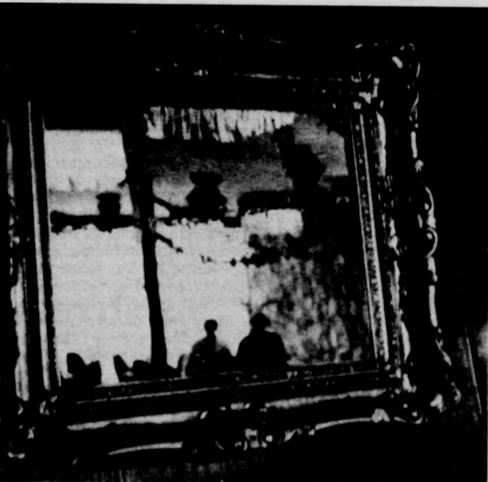
KÉSZÜLŐDÉS A FARSANGRA