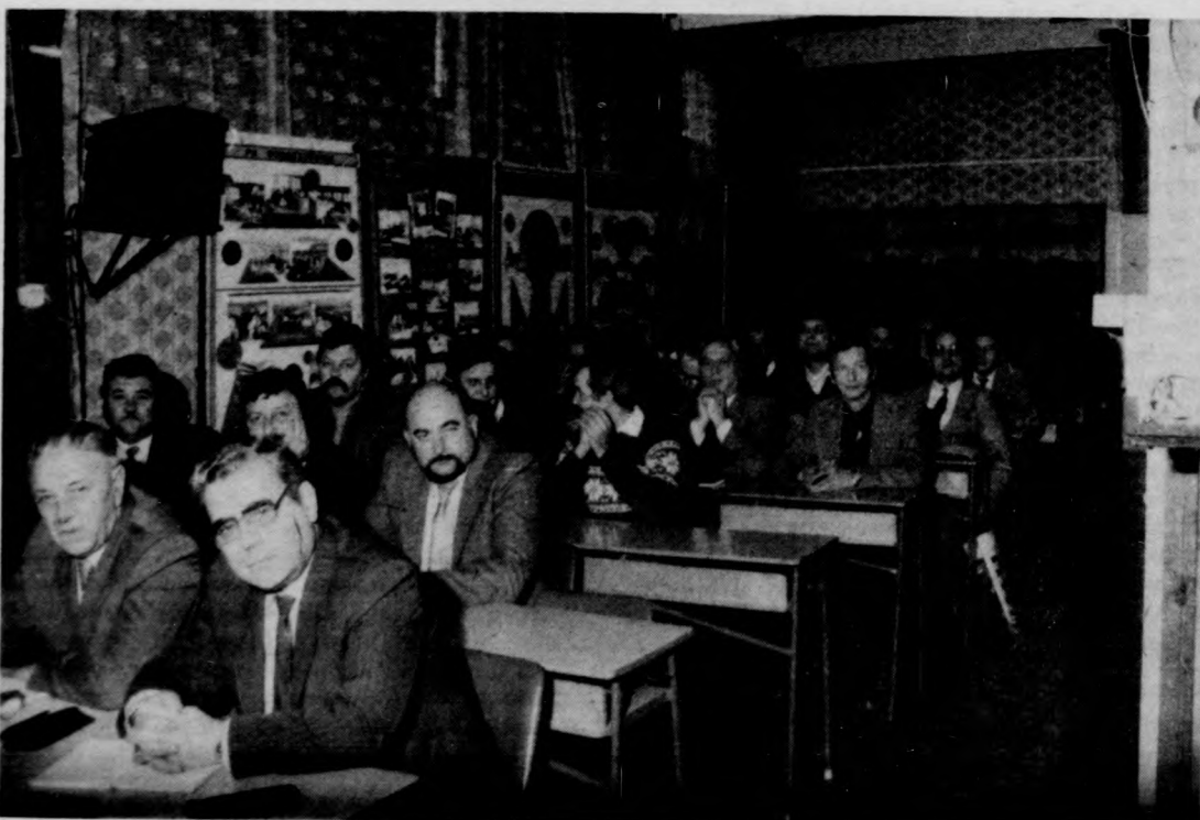
Termelőszövetkezeti vezetők polgári védelmi parancsnoki oktatáson