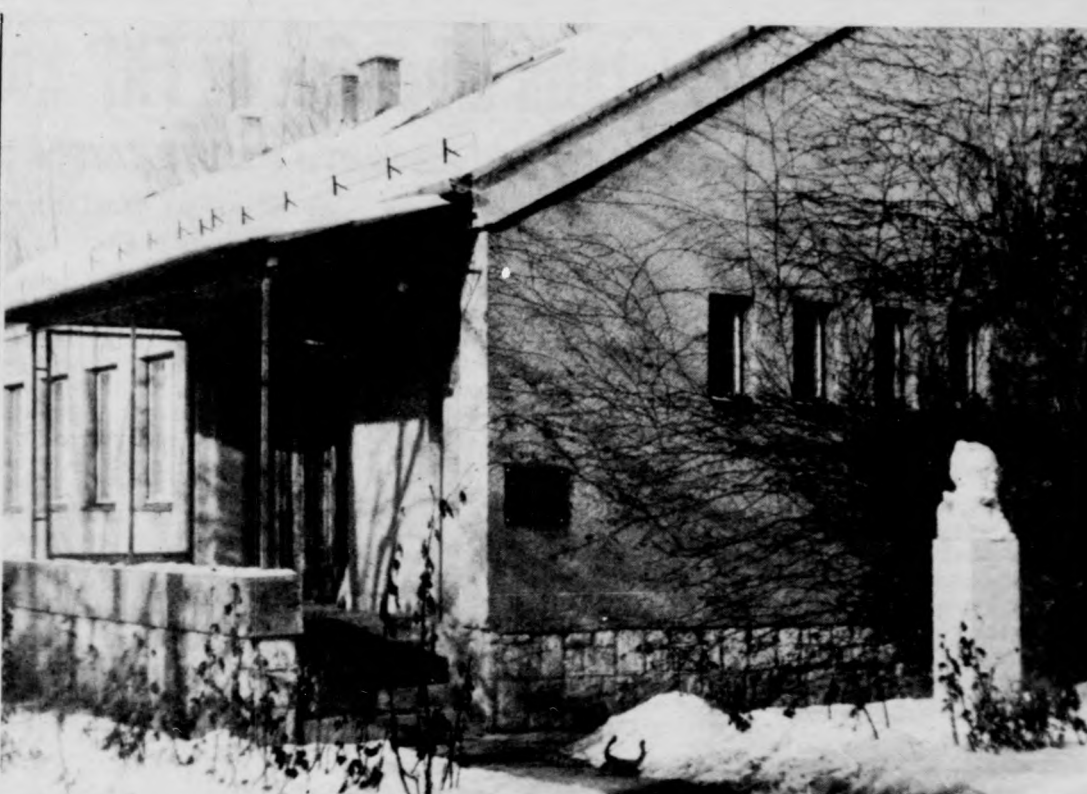
A kísérleti állomás épülete a nyugalmas arborétum mellett

Ezzel a módszerrel kevesebb abrakból olcsóbban több sertéshúst lehet előállítani. A választék és a helyben való keverés megkönnyítése érdekében komplett premix és szaplement gyártás is megkezdte az ISV. A fehérjék és tápkiegészítők könnyebb beszerezhetősége érdekében a Hajdú-Bihar megyei GMV-vel, TSZKER-rel és az Észak-Hajdúsági Mezőgazdasági Együttműködéssel az ISV szerződést kötött. A helyben való keverés a felhasználó mezőgazdasági nagyüzem részére 100 forint tiszta jövedelemmegtakarítást tesz lehetővé. Ez másrészt azt jelenti, hogy egy leadásra kerülő hízonál 120–160 forinttal nagyobb a haszon.