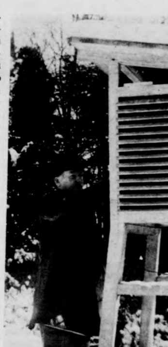
A meteorológiai észlelés is fontos része az erdészeti kutatásoknak

Egy tenyérnyi kis arborétumot leszámítva saját erdőterülete nincs az Erdészeti Tudományos Intézet püspökladányi tiszántúli kísérleti állomásának, mégis több mint ezer hektár kísérleti gazdájának érzi magát az a tizenegy dolgozó (két kutató, valamint technikusok, laboránsok stb.), aki a tájegység erdészeti kutatását végzi, szervezi.