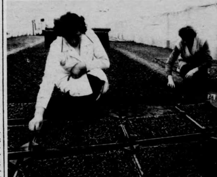
Tűzdelik a salátát, a paradicsomot és a karalábét