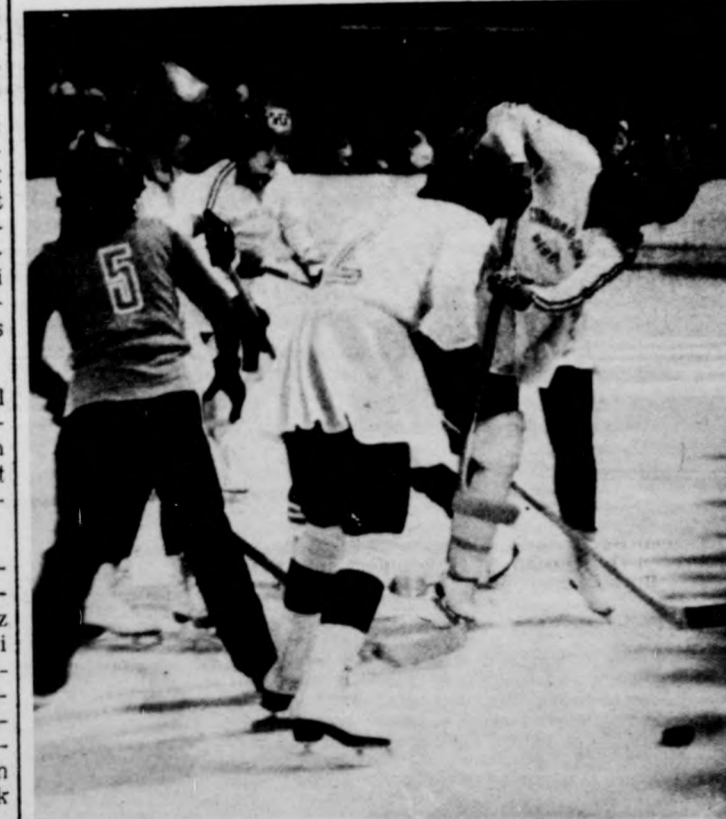
A fehér mezes és szoknyás csatárlány ütőfogása elárulja, hogy szívesen forgathatja otthon a seprűt

Nagy Gábor képei a minapi jégkarneválon készültek.