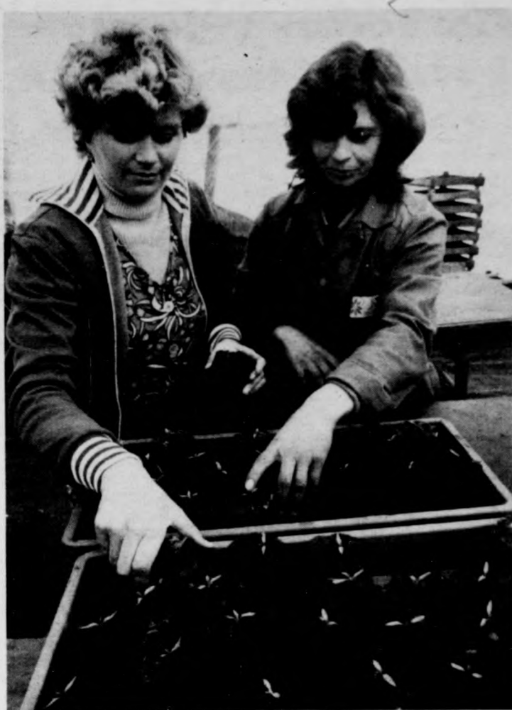
Készülnek a tápkockák

A jövő feladatai között a városi tanács jelentése azt hangsúlyozza, hogy a vállalatoknál változtatni kell a munkaerő-gazdálkodáson. Helyre kell állni a munkaerő-egyensúlyi helyzetnek. A színvonal javítása érdekében fontos volna egy könnyűipari üzem létesítése, hiszen ez munkát biztosítana az elhelyezkedni vágyó nők és pályakezdő fiatalok részére.