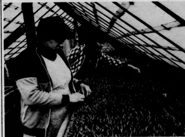
A szaporítóház már a kora tavaszi ideji

Az elképzelések valóra váltását 11 hektár termőföld, benne 11 ezer négyzetméternyi fóliaház és közel tízezer négyzetméter síkfólia szolgálja. A fóliaház ezeröttszáz-kétezer négyzetméteren már szépen fejlődik a kitűzött salátá és karalábé, s megkezdődött a paradicsom- és paprikaultetés is. Az időjárás nem a legkedvezőbb, sőt egyáltalán nem kedvező. Sokat kell fűteni, amellet a tartós hideg és a szél nemcsak a fóliasátrakat teszi próbára, hanem a tüzelőberendezéseket is, amelyekkel kapcsolatban egyébként ugyancsak fontos elképzelései vannak a szövetkezet vezetőinek. Azon túl, hogy már eljutottak a vegyes tüzelésig (olajat és fűrészpórt égetnek a kazánokban), a következő lépésben teljesen ki akarják iktatni az olajat. Tehetik, hiszen a kertészet közvetlen környezetében sok hulladék — így például nyomdaüzemi papírhulladék — képződik. A jövőt illetően az energiaszolgáltatás korszerűsítése (hulladékégetésre való áttáplása) a szakszövetkezet egyik legfontosabb tervezett programja. A másik, a fentiekből következő, hogy a jelenlegi 11-ről már a közeljövőben 20–25 hektárra kívánják növelni a zöldségtermő területet.