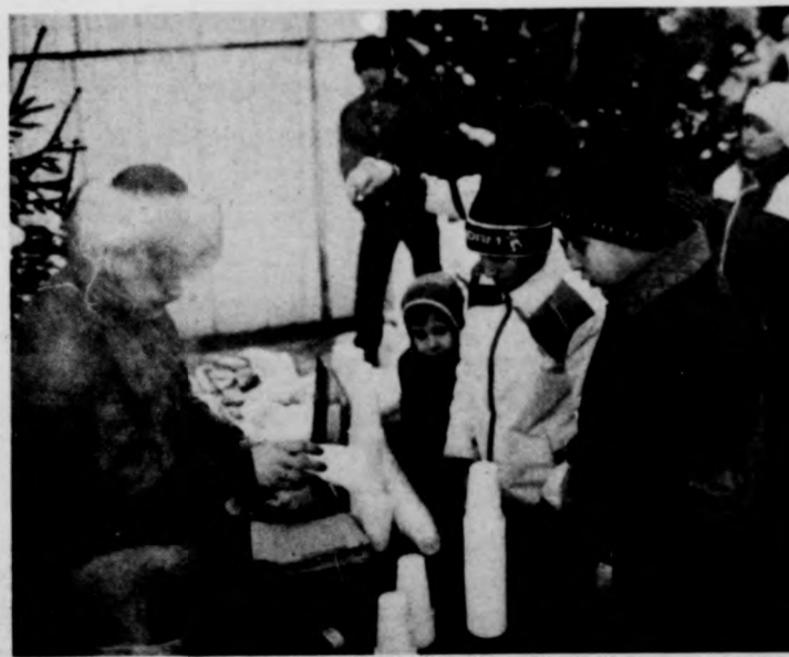
A rendezők forró teával és zsíros kenyérral gondoskodtak a kitaró nézők felmelegedéséről