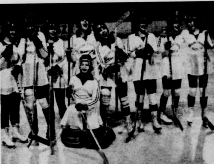
A Csokonai Gimnázium leánycsapata láthatóan örült a Tóth Árpád-osokkal való pontosztokodásnak (Csokonai—Tóth Árpád 1—1)