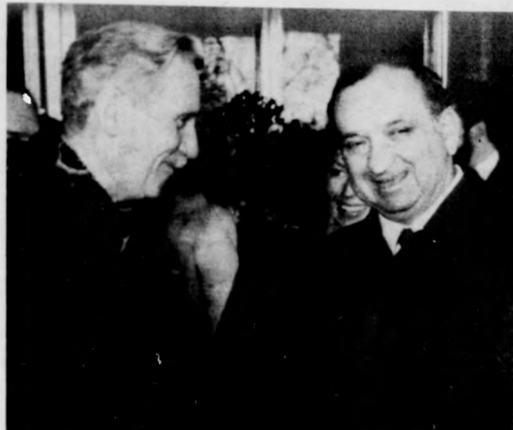
Lázár György miniszterelnök megkezdte ausztriai látogatását. A képen vendéglátójával, dr. Fred Sinowatz osztrák kancellárral látható

kedvező megítélésben részesítve a kormányfőt és kíséretét. A kormányfő és kísérete ezután szálláshelyére, az Imperial szállóba hajtatott. Lázár György, a kormány elnöke csütörtökön délután látogatást tett a bécsi városban. A miniszterelnököt és feleségét a városi tanács vezetőinek jelenlétében Helmut Zilk polgármester köszöntötte, meleg szavakkal méltatva az osztrák-magyar barátságát.