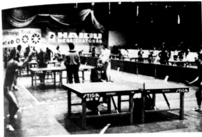
Nagyüzem — tucatnyi asztalon