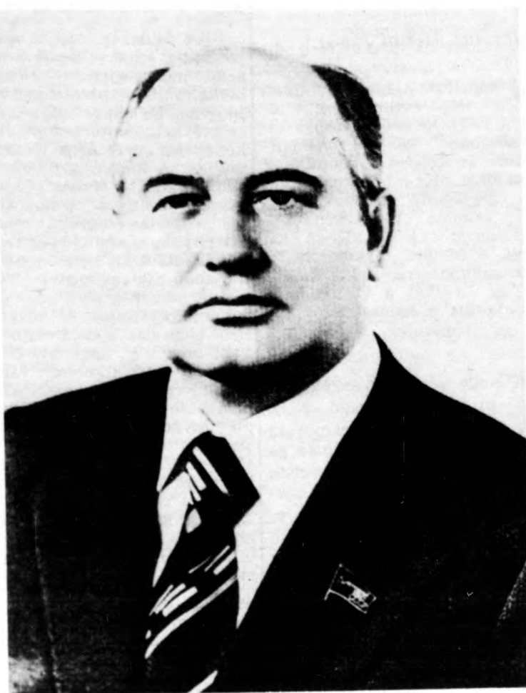
Mihail Gorbacsov, az SZKP KB új főtitkára 1931. március 2-án parasztszalad gyermekeként született a sztavropoli határterület krasznogvargyejszkoje járásnak Privolnoje nevű falujában.

Ezzel az SZKP Központi Bizottságának rendkívüli ülése befejezte munkáját.