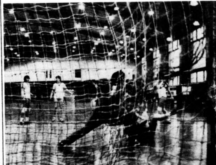
Egy kapu előtti jelenet a kapu mögöl