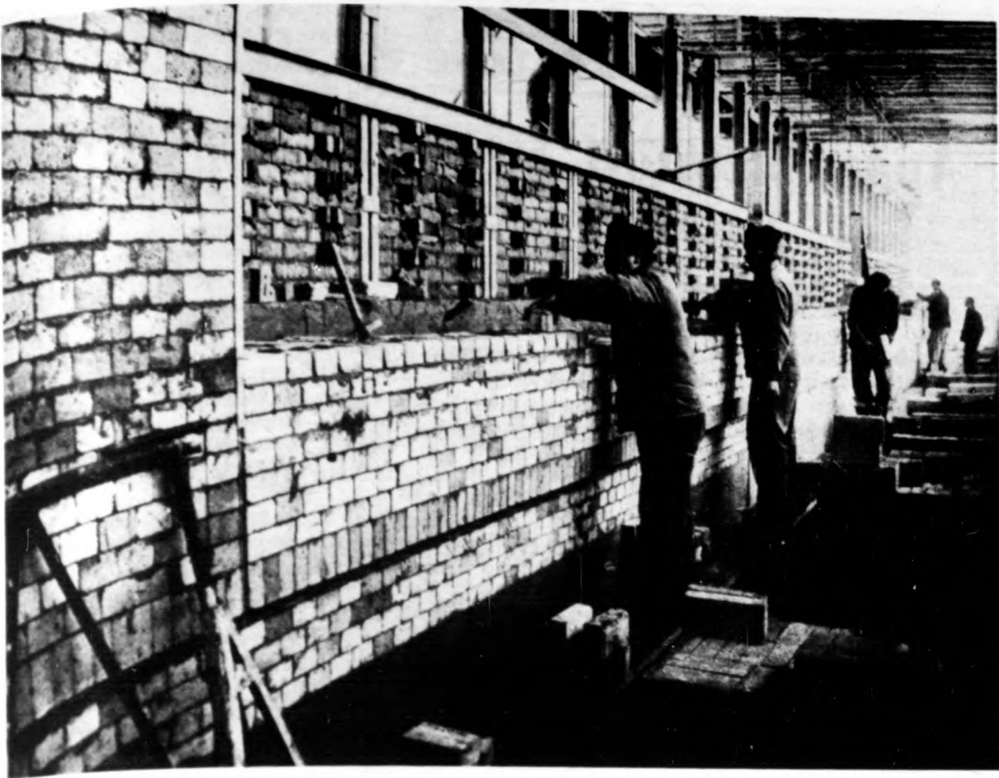
Az alagútkecske már félig kész