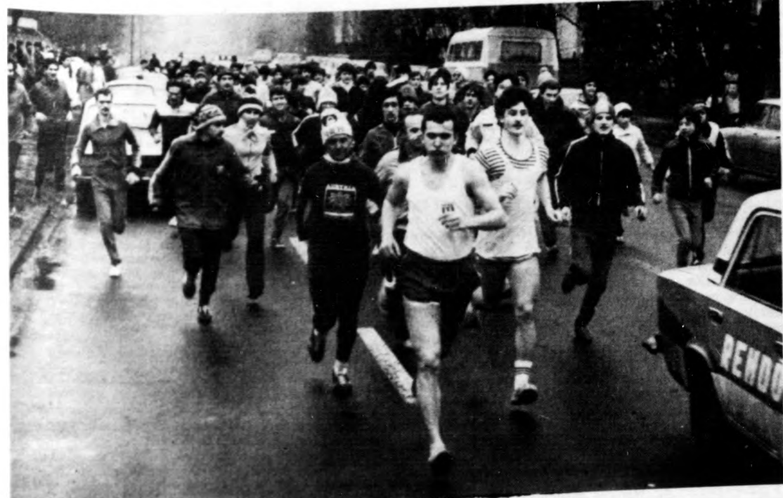
Rajtol a kocogók mezőnye

fiatalok vettek részt. A táv teljesítése után a célba éréskor a rendezőtől egy-egy csokoládét kaptak jutalmul. A rendezvény befejezéséig a BARNEVAL által felajánlott öt pulykát sorsolták ki a futók, kocogók között.