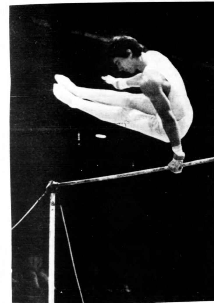
Paprika a nyújtón

A jól sikerült egyetemi és főiskolai tornászajtnokság győztesei.