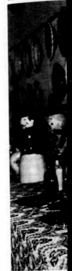
Egy kiállítás biharnagybajor

Az író-népr Sándor falujáró szok, pákászok, rek vidékéről lenne nem izes fordulatossá stí esetleg egy-két is fölémlítve. M mégis el kell k a méltatlanságo ka Zoltán, a bi mi művelődési ja olyan beszár látatokat, stat rit ki, amelyek