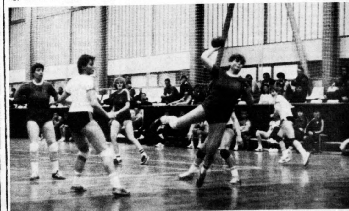
A Borsodi Bányász támad a Bakony Vegyész ellen Hajdúböszörményben