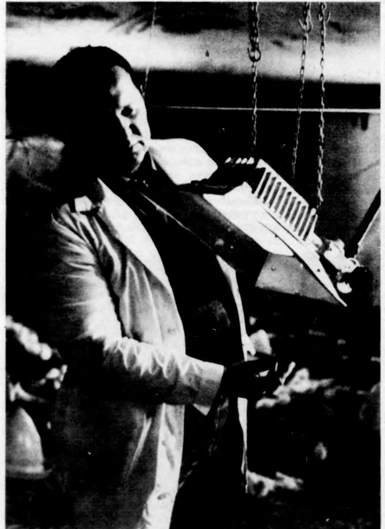
A HAGE telepein közel 600 infravörös hőszugárzó évente több millió forintnyi energiát takarít meg

Minden forgalomban levő gépalkaokhoz csatlakoztathatók az infravörös hőszugárzó, de üzemeltethetők vezeték nélküli távvezérléssel is. Egy-egy ilyen készülék hat-nyolcszáz csirke részére tud optimális mikroklímát teremteni. Az infravörös hőszugárzó előnye, hogy a levegőt nem melegíti fel, csak az állatokat kelt hőérzetet.