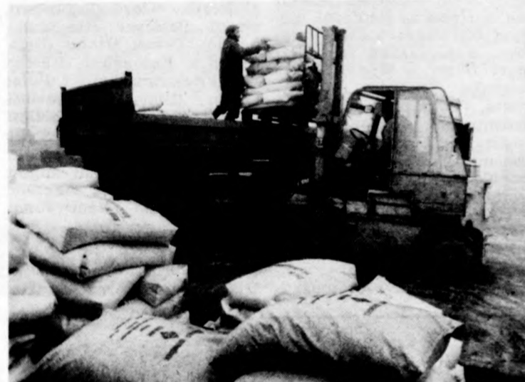
Folyamatosan szállítják a kevert, összetett műtrágyákat

Ez a kis szünet, ha a műtrágyák oldaláról nézzük, még hasznos is. Nem a műtrágyák mennyiségével van gond, a mázsás igényeket ugyanis ki tudja elégíteni az AGROKER és a TSZKER, hanem a választékukkal. Az AGROKER a nitrogén hiányát (agronit 28 száza-