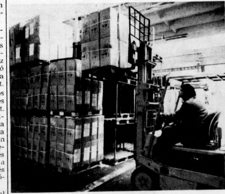
Növényvédő szer érkezett

Egét gond egyelőre sehol nincs a megyében. Remélhető, mondják az illetékesek, a jövőben a szállítások ütemezése is megfelelő lesz.