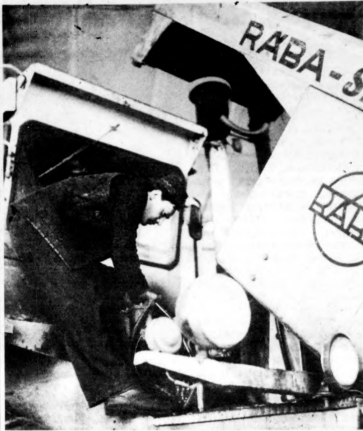
Javításra szorul a Rába

Népfrontunk fegyveres erői: a Magyar Néphadsereg, a Határőrség és a Munkásvédelmi egységei — április 4-én Budapesten katonai díszszemlével köszöntik hazánk felszabadulásának 40. évfordulóját. Dél-élelt 10 órakor — immár huszadik alkalommal — hangzik majd fel a díszszemlére szólító harsona hangja a felvonulási téren.