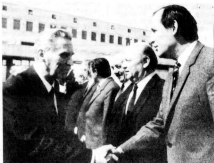
Lázár Györgytől Maróthy László búcsúzik

Lázár György, a Magyar Szocialista Munkáspárt Politikai Bizottságának tagja, a Minisztertanács elnöke a hazánk felszabadulásának 40. évfordulójára rendezett moszkvai jubileumi kiállítás megnyitására párt- és kormányküldöttség élén vasárnap a Szovjetunióba utazott. A delegáció tagjai: Havasi Ferenc, az MSZMP Politikai Bizottságának tagja, a Központi Bizottság titkára, Faluvégi Lajos és Marjai József, a Minisztertanács elnöke-