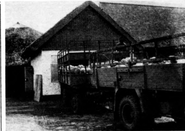
Megérkezett a szállítmány: pecsenyebárányok

A távbeszélő szolgáltatást igénybe vevőkkel tudatja a posta, hogy Hajdúböszörmény külön göcterület. Debrecenből például tehát a helyi társaság után a 06-ot, a következő társaság után az 55-ös körzetszámot és folyamatosan a hívni kívánt hajdúböszörményi előfizető ötjegyű számát kell tárcsázni. A külön göcterület azt is jelenti, hogy Hajdúböszörmény és a megye többi távhívó hálóra kapcsolt előfizetői közötti beszélgetések díjazása második díjkörzet szerint történik.