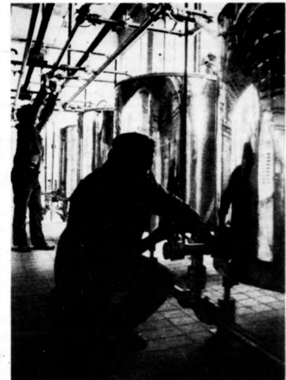
A krómácellák tartályok szerelése