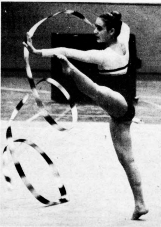
Jelenet a csütörtöki délelőtti edzésről

Mától kezdődik a debreceni városi sportcsarnokban a VII. magyar-nemzetközi ritmikus sportgimnasztikai verseny Debrecen város Nagydíjáért. A háromnapos viadalon