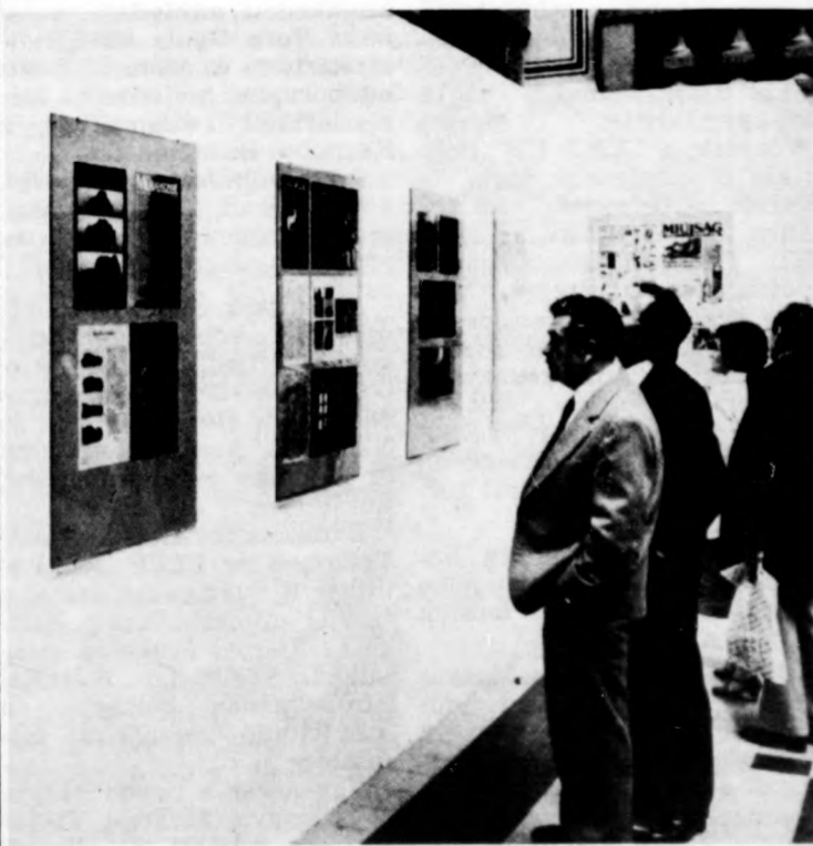
Tótfalusi Kis Miklós-díjas grafikusok alkotásából nyílt kiállítás