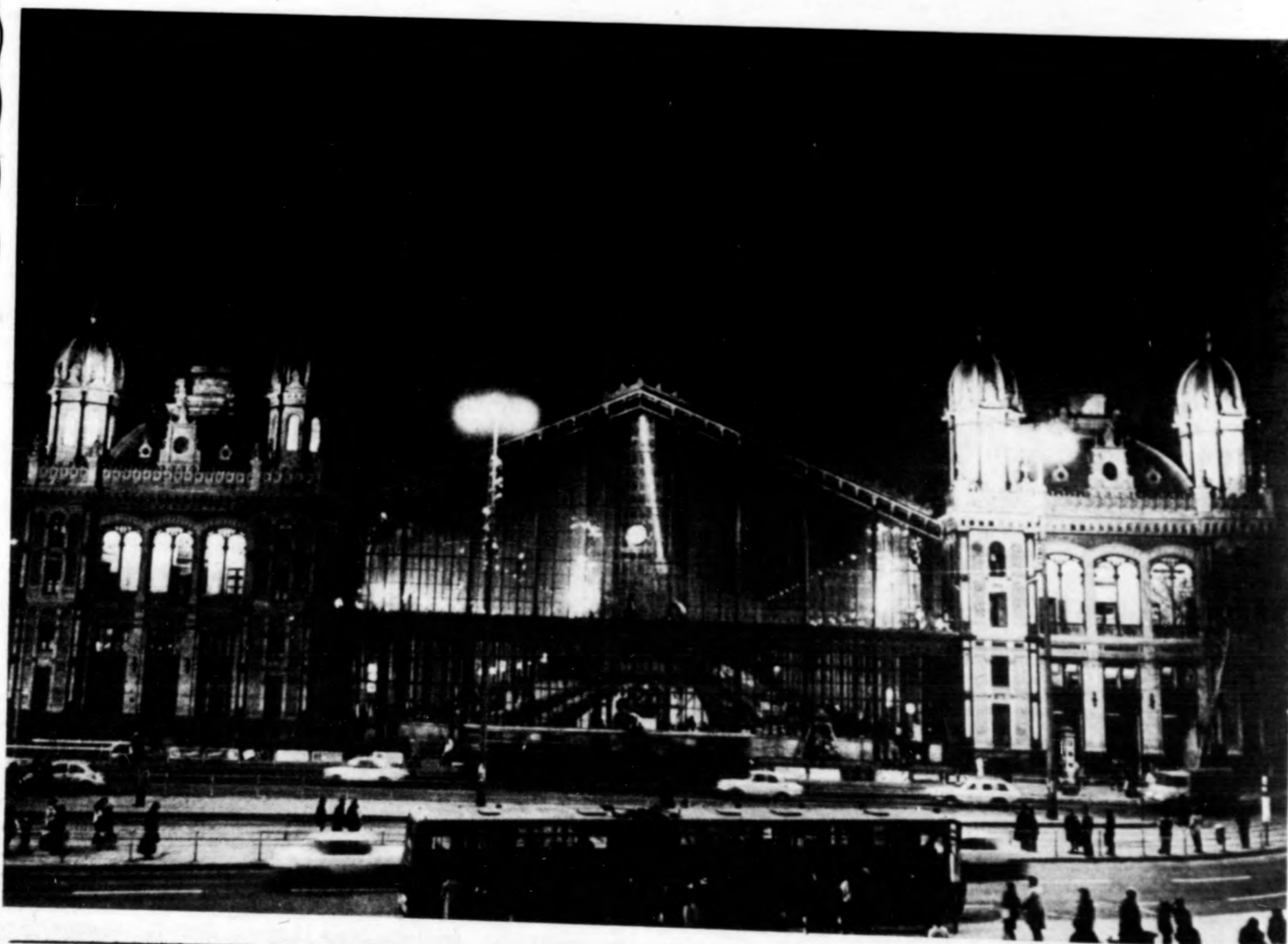
BUDAPEST. ELKÉSZÜLT A NYUGATI PÁLYAUDVAR DÍSZKIVILÁGÍTÁSA