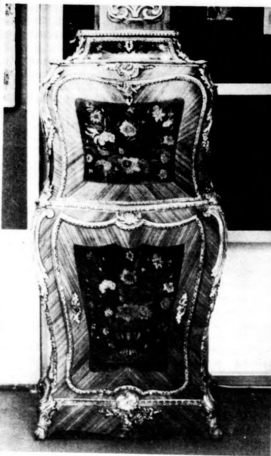
Rózsafa írószekrény berakásokkal XV. század stílusban. Franciaország, XIX. század