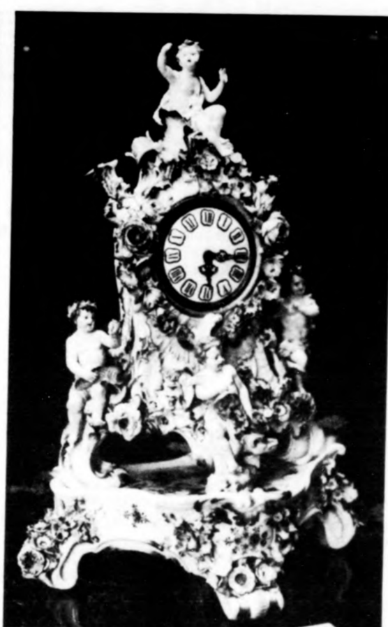
Asztali óra talpazattal Meissen 1900 körül