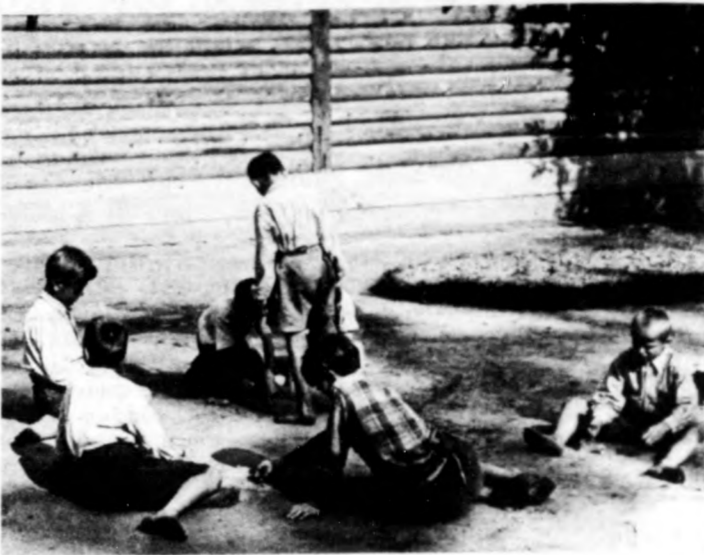
Füük egy csoportja játék közben a hajdúhadházi gyermekvárosban, 1947-ben. Fotó Charles Falus. Beküldte: Csuka Lajosné, Debrecen