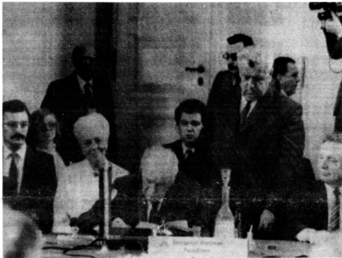
A képen Kádár János aláírja a dokumentumot

A küldöttségek pénteken lerótták kegyeletüket a lengyel nemzet felszabadítási küzdelmek harcosai és a Lengyelország felszabadításáért elesett szovjet hősök emlékének.