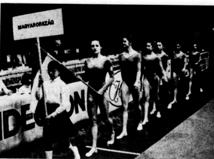
A magyar csapat

Kiállítások: 4, illetve 10 perc. Hétméteresek: 5/4, illetve 5/2. Az eredmény alakulása: 2 perc: 0-1, 10 perc: 6-2, 18 perc: 8-6, 22. perc: 12-7, 35. perc: 20-12, 46. perc: 28-15, 53. perc: 33-18.