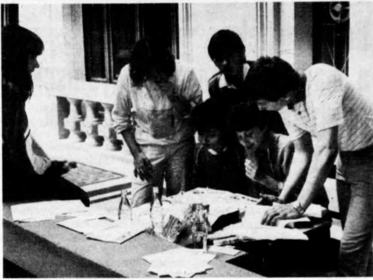
A polgári gimnázium VIT-vágtá csapata

Miközben a választási szervek a hivatalos dolgok intézését végzik, a következő hetekben a képviselő- és tanácsjelölteknek arra lesz lehetőségük, hogy találkozzanak választóikkal, bemutatkozzanak, ismertessék programjukat. Tanácsági választókerületben csak kivánságra kerül sor gyűlések tartására, a képviselői kerületekben viszont mindenütt tartanak választási gyűlést. Debrecenben választási nagygyűlés lesz. A választási gyűlések alkalmat nyújtanak rá, hogy azok az érdeklődő választópolgárok is megismerjék a jelölteket, akik valamilyen okból a jelölőgyűlésen nem tudtak részt venni.