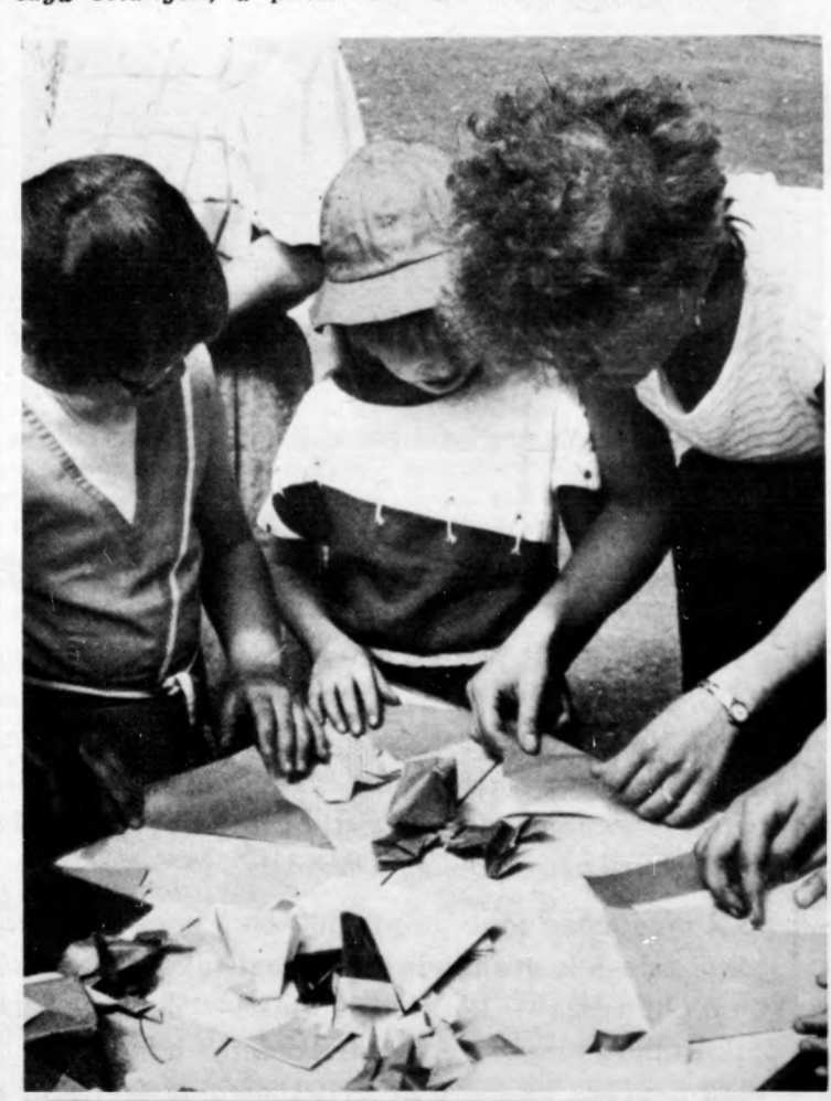
Gyermekprogram: papírhajtogatás