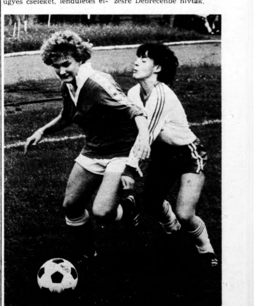
Elszántság az arcokon