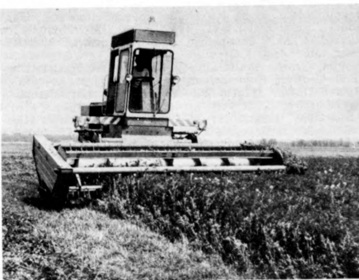
A lucerna szénának való betakarítását május 2-3-án kezdték meg