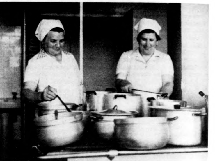
A konyhában állítólag ma is jóízű ételt főznek

Az étterem körül kialakult helyzet tanulságai azonban jóval túlmutatnak az egyetemi példán. Nagyon sok településen alakulnak ki vagy termelődnek újra olyan rétegek,