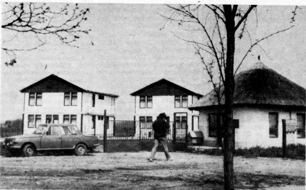
Sokan keresik fel az új kempinget