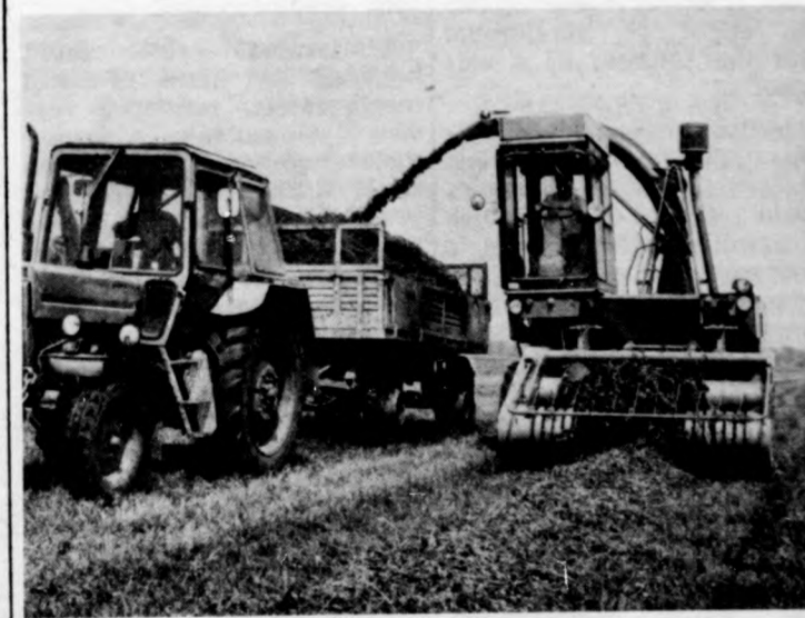
A friss takarmány napi ezer literrel növelte a tejjelhozamot

Az utasítás kimondja, hogy a szülőket is érintő iskolai rendezvények — például a tanévnyitó és tanévzáró ünnepély, a ballagás, a szülői értekezletek — csak az általános munkaidőn kívüli időpontban szervezhetők. (MTI)