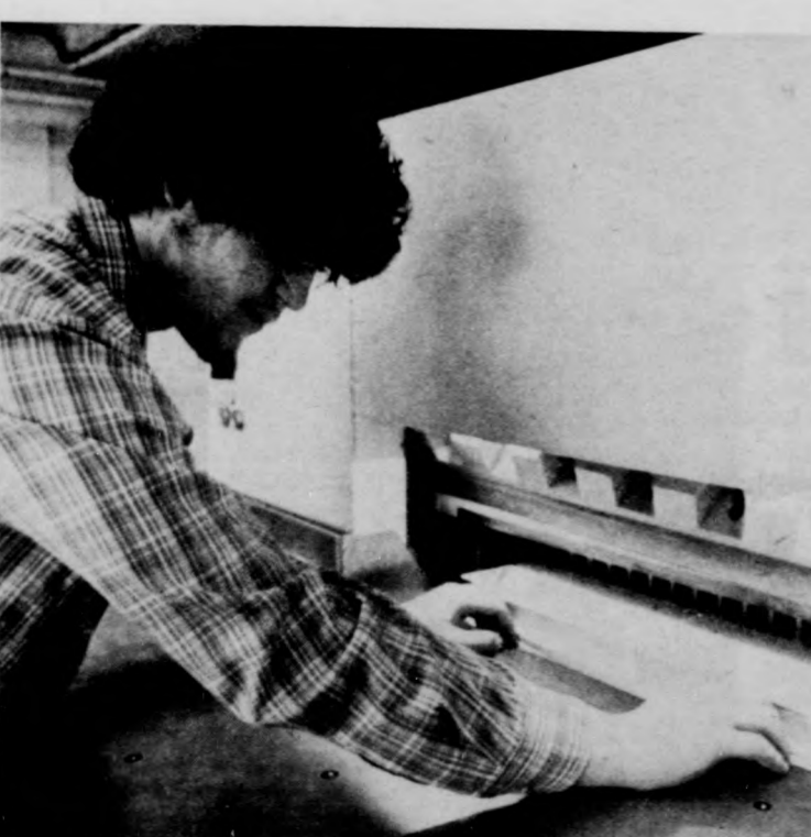
Méretre darabol a vágógép

A tervek szerint a létszámot Vámospercsről és a környező községekből az év végéig 25-re fejlesztik fel — többségében megváltozott munkaképességű dolgozók alkalmazásával.