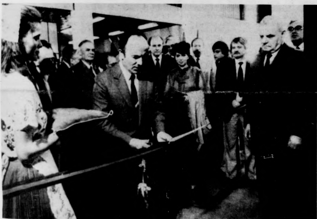
Veress Péter külkereskedelmi miniszter megnyitja a vásárt

Akik a választás napján előreláthatólag nem tartózkodnak lakóhelyükön, azok június 7-ig kérjék tartózkodási helyükön nyilvántartásba való felvételüket. Ehhez mutassák be az állandó lakóhelyük szerint illetékes helyi tanács végrehajtó bizottságának igazolását választójogukról. Az igazolás alapján június 8-án a szavazatszedő bizottság is lehetővé teszi a választópolgár számára a szavazást, de az ideiglenes tartózkodási helyen csak az országos választási listára lehet szavazni. (MTI)